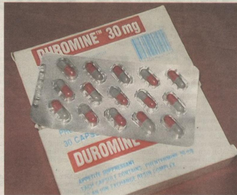
PIL Duromine boleh mendatangkan bahaya jika digunakan tanpa merujuk kepada doktor terlebih dulu. - Gambar hiasan

"Pil tersebut juga akan mengganggu metabolisme hati di mana hati tidak dapat memproses glukosa dengan sempurna dan ak-