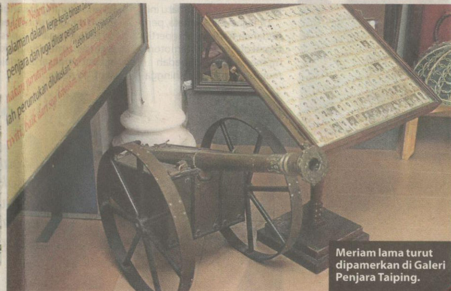
Meriam lama turut dipamerkan di Galeri Penjara Taiping.