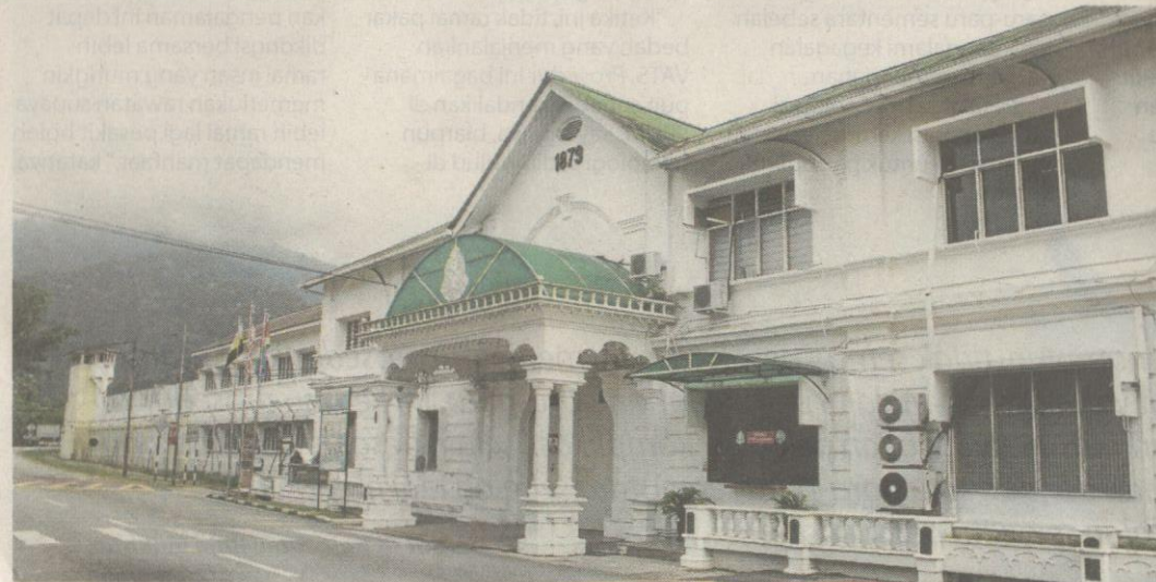
Penjara Taiping masih berdiri kukuh walaupun berusia 112 tahun.