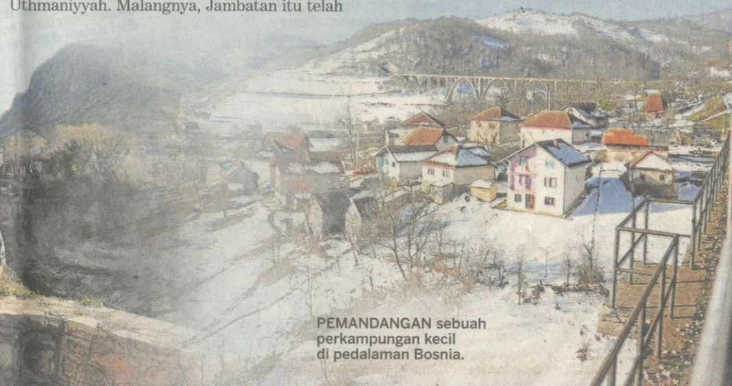
PEMANDANGAN sebuah perkampungan kecil di pedalaman Bosnia.

Lawatan ini berakhir apabila saya meneruskan perjalanan menaiki bas ke bandar Dubrovnik, Croatia.