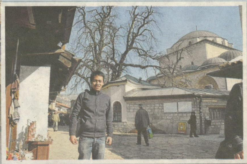
AMER mengambil gambar di Bascarsija dengan berlatarbelakangkan Masjid Gazi Husrev Beg.