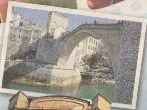
INILAH jambatan Stari Most atau Old Bridge di Mostar.