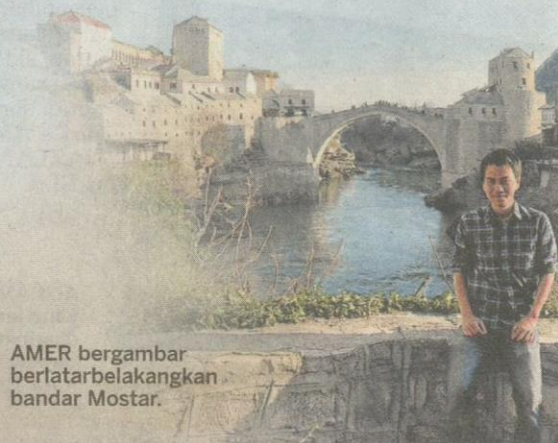
AMER bergambar berlatarbelakangkan bandar Mostar.

Ini disebabkan oleh pemimpin-pemimpin yang tidak mencapai kesepakatan kerana