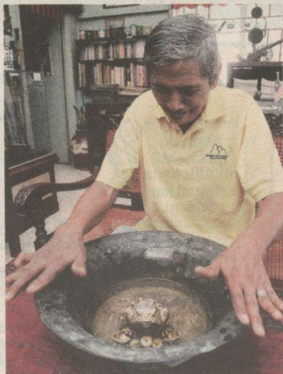
MANGKUK terapi tangan ini boleh menghasilkan bunyi dengung yang kuat.