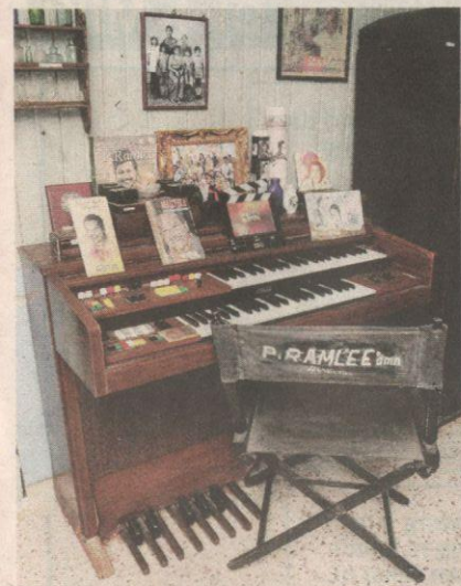
KOLEKSI piring hitam, majalah lama dan kerusi bertema Tan Sri P. Ramlee.