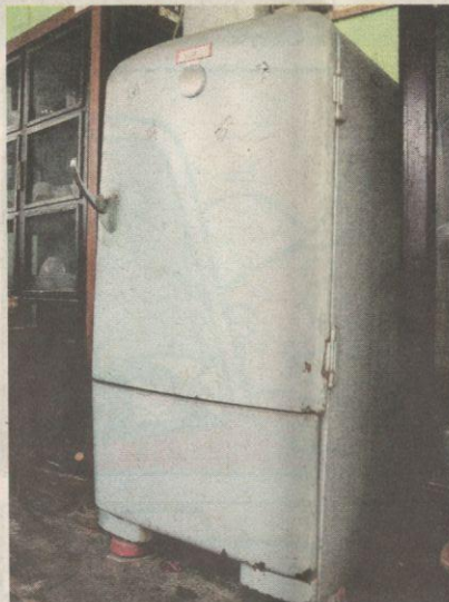
PETI ais tahun 1940 ini masih berfungsi dengan baik.