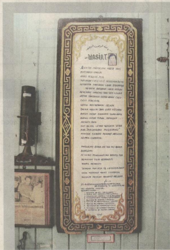
NORDIN mewasiatkan agar koleksinya tidak dijual.