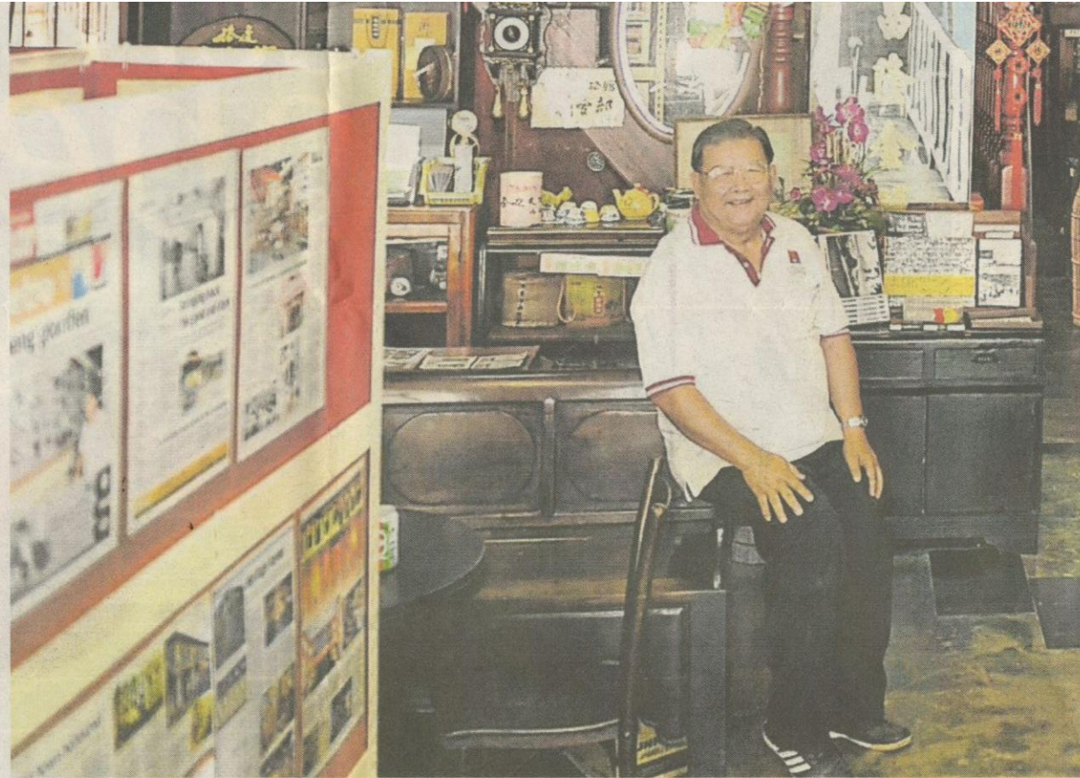
See Kong berbangga untuk berkongsi sejarah di Muzium Gopeng.

Sambil koleksi antik diberi secara percuma oleh penggemar barangan antik, bekas guru di