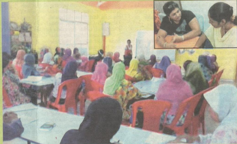
PARA peserta yang mengikuti projek Majudiri diberi bimbingan untuk lebih berdaya dalam perniagaan.

1,190 peserta telah menyertai projek tersebut dan ia masih memberi peluang kepada orang ramai untuk turut serta dalam program seterusnya.” jelasnya.