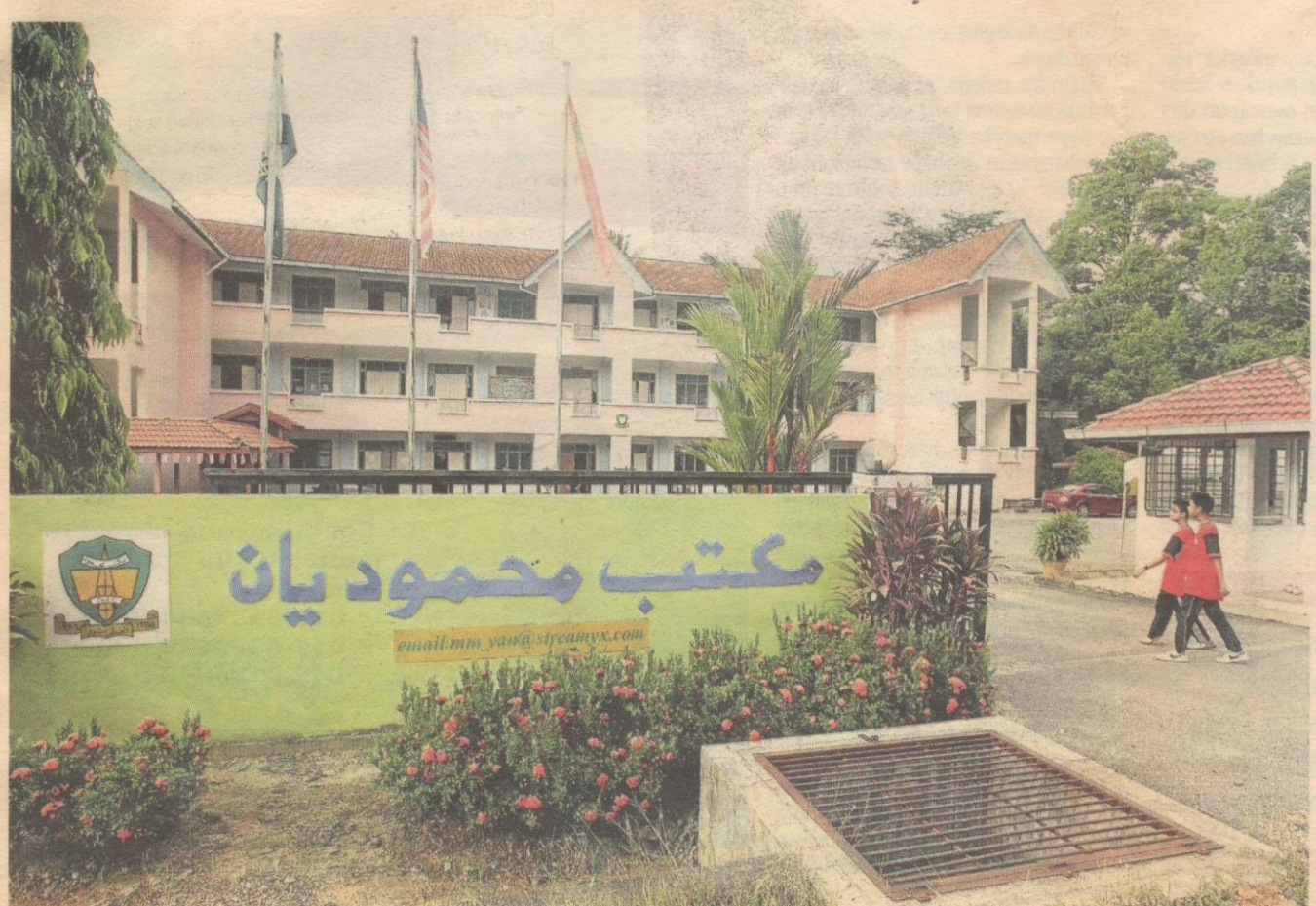
MAKTAB Mahmud yang kini menggunakan tapak asal sekolah masyarakat Aceh di Yan.