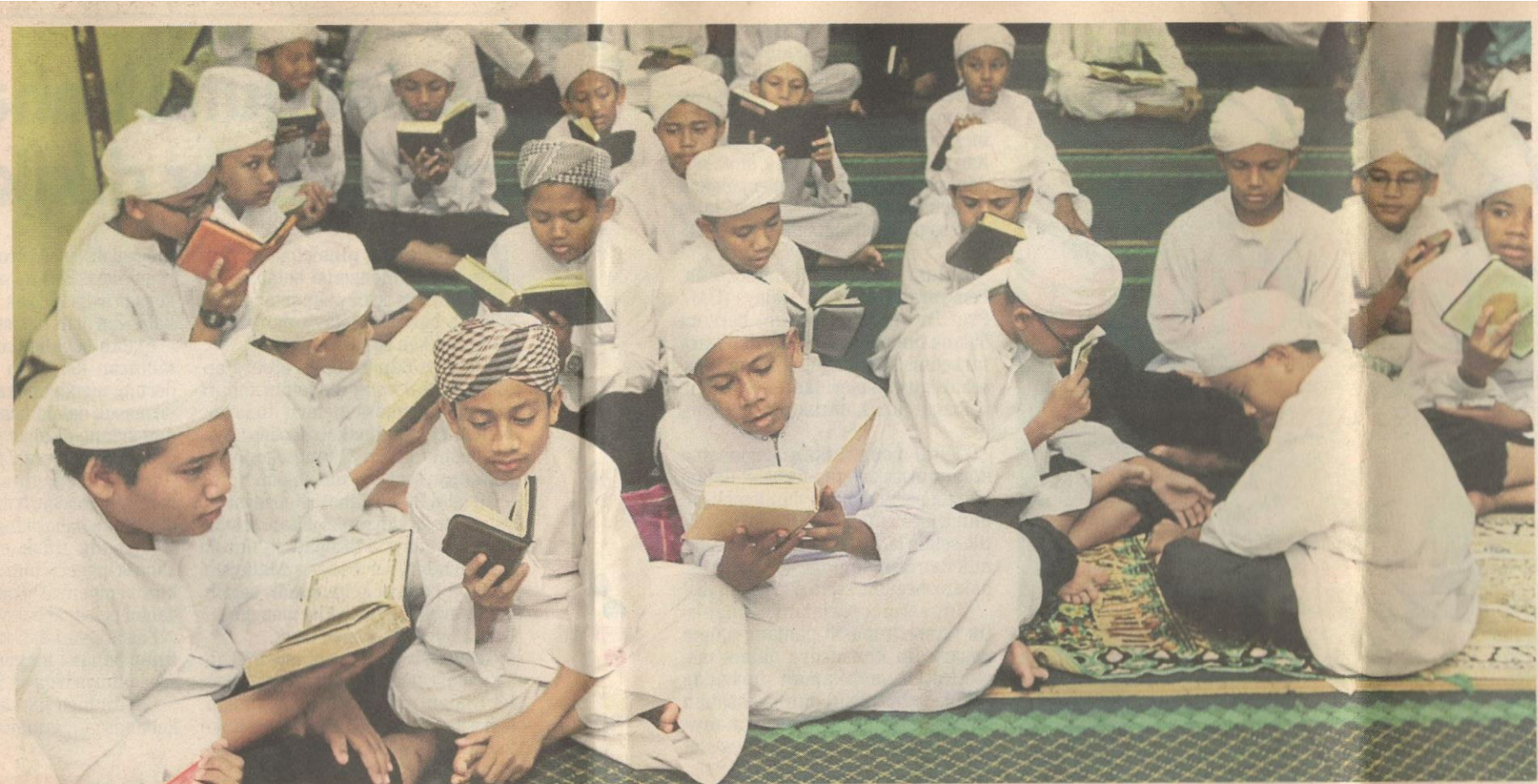
ANTARA pelajar Maktab Mahmud yang meneruskan sistem pendidikan agama dan bahasa Arab di Kampung Aceh.