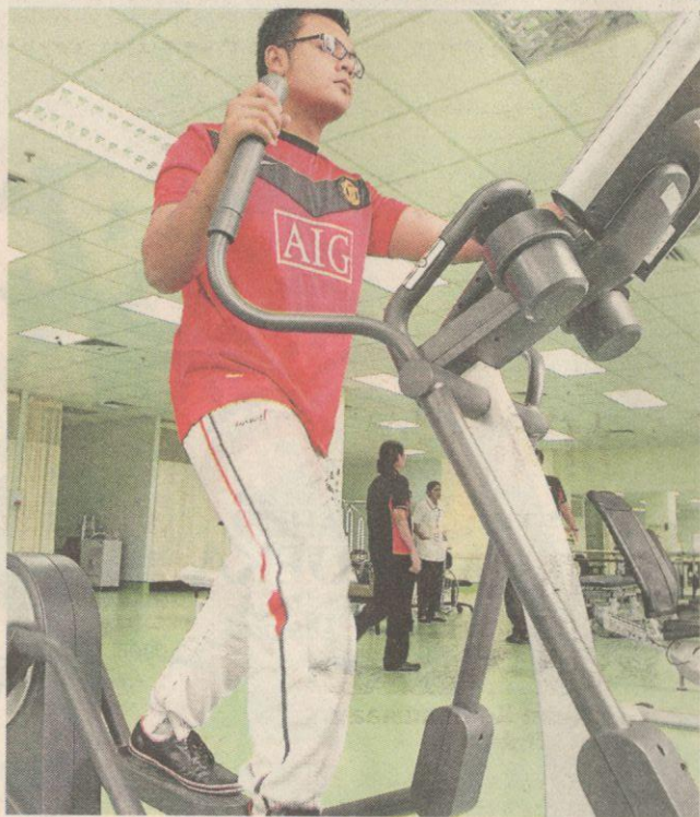
BERSENAM...menjaga kesihatan adalah tuntutan agama.

M ENJAGA kesihatan suatu yang dituntut Islam. Rasulullah s.a.w amat menekankan kebersihan dalam kehidupan seharian. Hinggakan tidak sah ibadat khusus seperti solat tanpa berwuduk. Bersuci setiap hari juga dituntut dan ia dapat dinisbahkan zaman sekarang dengan menggosok gigi. Kita juga dituntut mandi dan membersihkan diri setiap hari. Mandi pula wajib untuk membersihkan diri selepas berhadass besar.