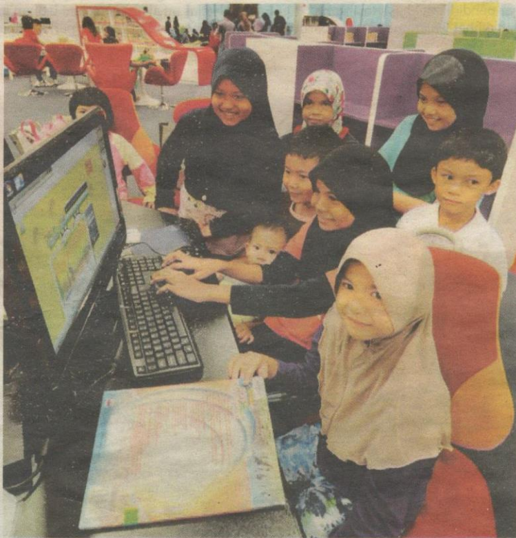
Kegembiraan kanak-kanak menggunakan komputer di Zon Siber.

Perpustakaan Raja Tun Uda meneruskannya.