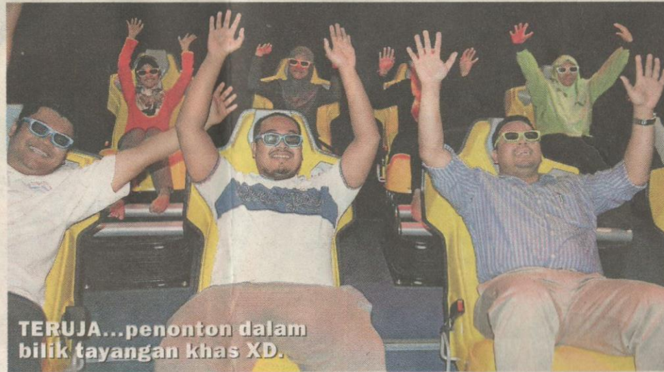
TERUJA...penonton dalam bilik tayangan khas XD.

"Bilik tayangan ini dibuka setiap hari bermula jam 9 pagi hingga 7 malam manakala pada hujung minggu