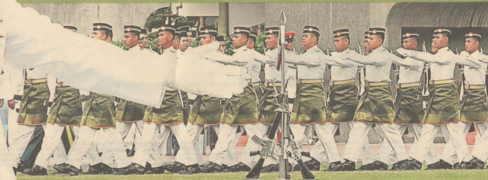
Perbarisan Askar Melayu Diraja sempena sambutan Hari Pahlawan, semalam.

"Kepercayaan badan dunia berkenaan dalam mengiktiraf Malaysia sebagai pasukan penganaman dan pemerhati bermula sejak 1960 lagi," titah baginda.