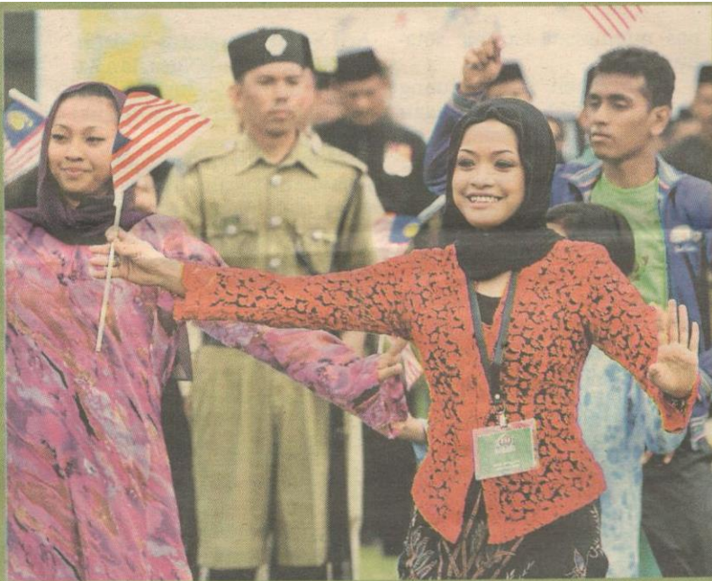
Antara persembahan yang melambangkan perpaduan dan keamanan negara.