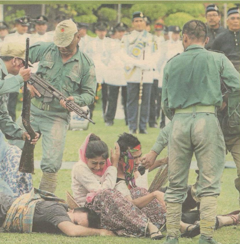
Pelbagai acara dan persembahan mengingati perjuangan pahlawan negara menentang musuh sempena Sambutan Hari Pahlawan 2012, semalam.