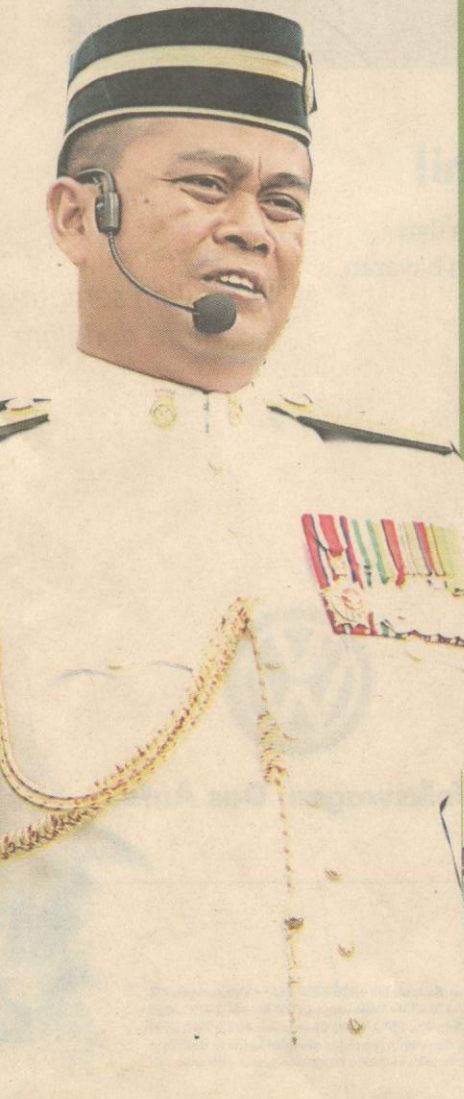
Anggota Tentera Malaysia menyampaikan sojak Hari Pahlawan di Dataran Merdeka, semalam.