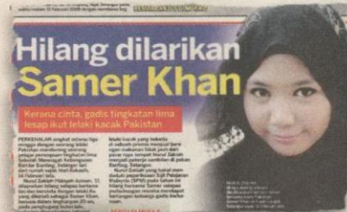
KERATAN muka depan Kosmo! semalam.