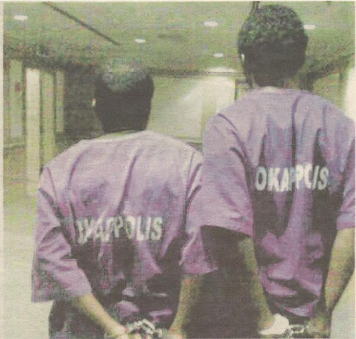
DUA warga Nigeria ditahan akibat memperdaya wanita tempatan sebagai keldai internet.