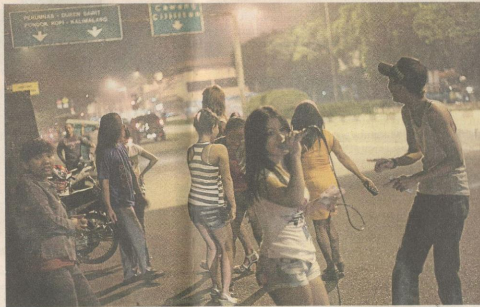
HIBURAN...penyanyi dangdut membuat persembahan di jalanan sekitar Jakarta.