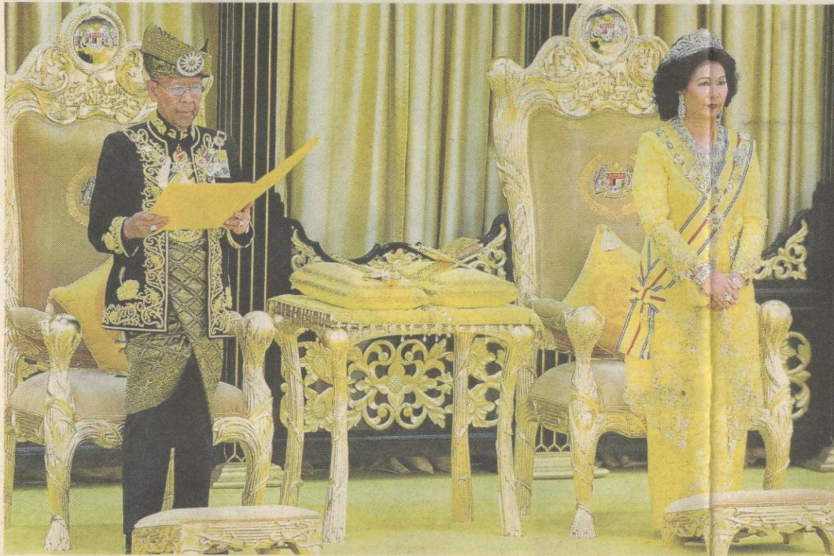
TUANKU Abdul Halim Mu'adzam Shah melafazkan ikrar sempena Istiadat Pertabalan Yang di-Pertuan Agong ke-14 di Istana Negara, semalam. Turut berangkat, Raja Permaisuri Agong Tuanku Hajah Haminah.