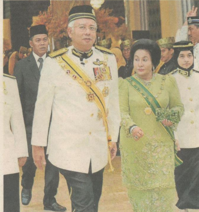
PERDANA Menteri, Datuk Seri Najib Razak dan isteri, Datin Seri Rosmah Mansor tiba di Istiadat Pertabalan Yang di-Pertuan Agong Ke-14 Tuanku Abdul Halim Mu'adzam Shah di Balaiorong Seri, Istana Negara, semalam.