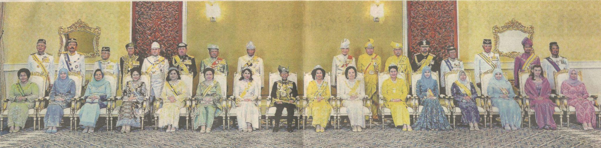
YANG di-Pertuan Agong Tuanku Abdul Halim Mu'adzam Shah dan Raja Permaisuri Agong Tuanku Hajah Haminah berkenan bergambar kenangan bersama Raja-Raja Melayu dan Permaisuri masing-masing, wakil-wakil Raja-Raja Melayu, Gabenor-Gabenor, Yang Di-Pertuan-Yang Di-Pertua Negeri, Perdana Menteri dan isteri serta Timbalan Perdana Menteri dan isteri sempena Istiadat Pertabalan Yang di-Pertuan Agong Ke-14 di Istana Negara, Jalan Duta, semalam.