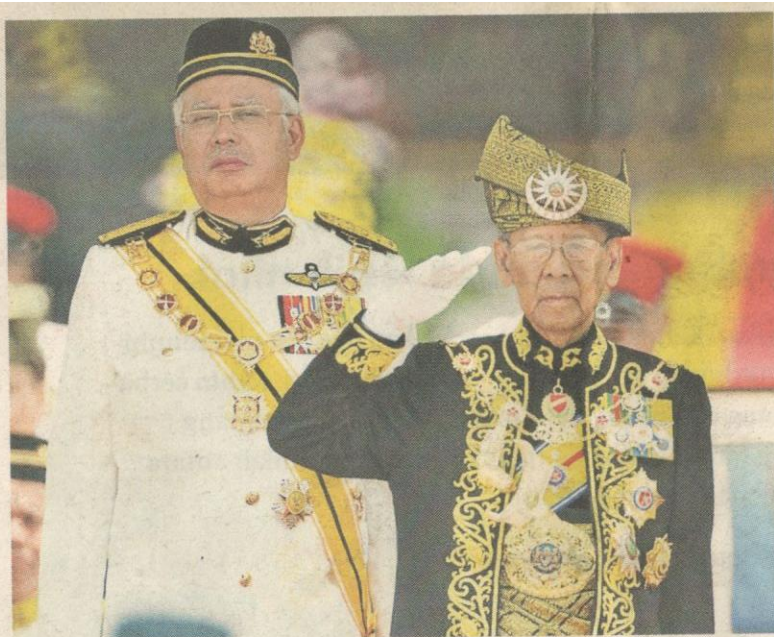
Yang di-Pertuan Agong Tuanku Abdul Halim Mu'adzam Shah berangkat pada Istiadat Pertabalan Yang di-Pertuan Agong ke-14 diiringi Najib di Istana Negara, semalam.

“Maka jadilah insan yang mulia sebagai mana dituntut agama, iaitu insan yang berilmu dan berpekerti mulia serta sedar dan patuh ter-