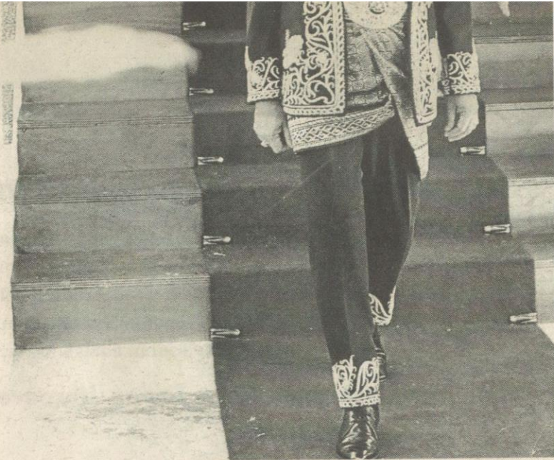
PERTABALAN Yang di-Pertuan Agong Tuanku Abdul Halim Mu'adzam Shah pada 21 September 1970 diiringi Perdana Menteri ketika itu, Tun Abdul Razak.

“Kemajuan dari segi kebendaan saja belum cukup untuk menjadikan kita satu bangsa yang kuat. Kita perlu menjaga dan mengamalkan ciri-ciri hidup masyarakat