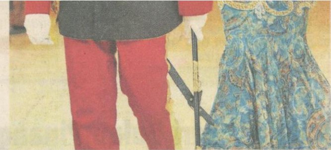
PUTERA Mahkota Brunei, Pengiran Muda Haji Al-Muhtadee Billah dan Pengiran Anak Isteri Pengiran Anak Sarah Pengiran Salleh Abdul Rahaman berangkat sempena Istiadat Pertabalan Yang di-Pertuan Agong Ke-14, Tuanku Abdul Halim Mu'adzam Shah di Balaiorong Seri, Istana Negara, Jalan Duta, semalam.