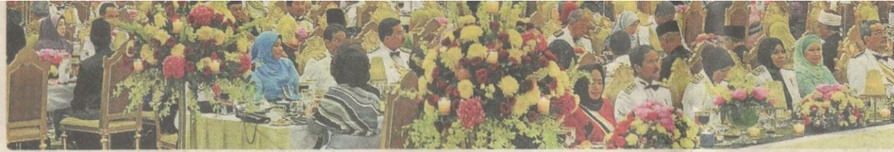
YANG di-Pertuan Agong, Tuanku Abdul Halim Mu'adzam Shah bersama Raja Permaisuri Agong, Tuanku Haminah berangkat pada majlis santapan sempena Istiadat Pertabalan Yang di-Pertuan Agong Ke-14 di Istana Negara, Jalan Duta, malam tadi.