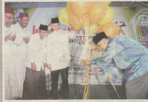
MENTERI di Jabatan Perdana Menteri, Tan Sri Nor Mohamed Yakcop (kanan) merasmikan Festival Sambutan Kebudayaan dan Warisan India Muslim.