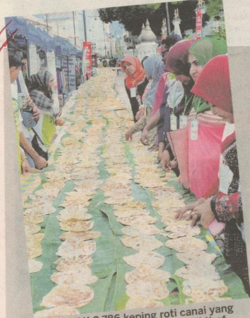
SEBANYAK 2,786 keping roti canai yang disusun sepanjang 400 meter diiktiraf MBOR sebagai susunan roti canai terpanjang di Malaysia.