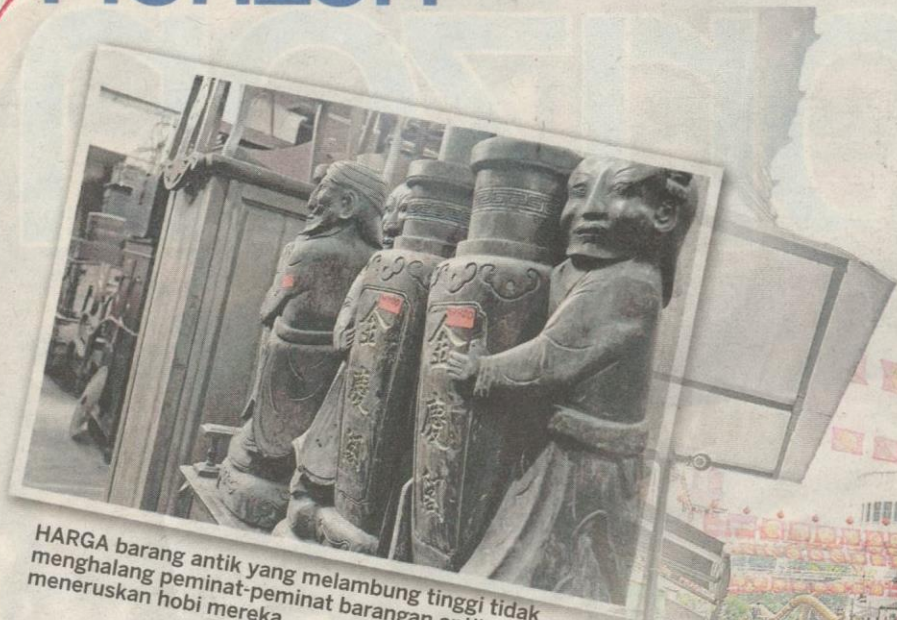
HARGA barang antik yang melambung tinggi tidak menghalang peminat-peminat barangan antik meneruskan hobi mereka.

SENI bina bangunan yang bercirikan golongan Peranakan menjadi identiti di Jonker Walk.