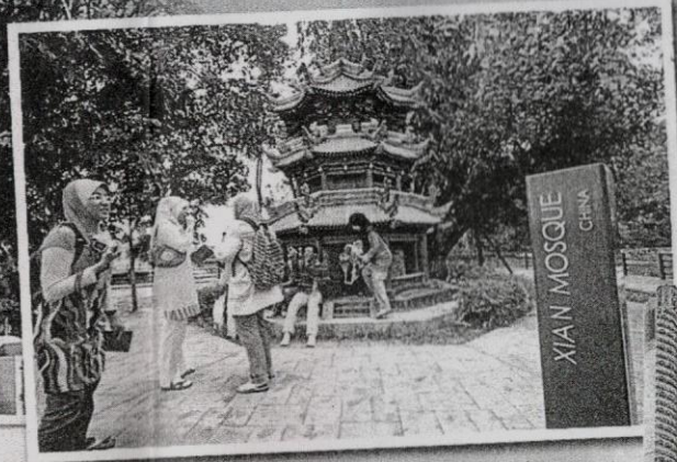
MASJID Xian dari China yang tetap menerapkan reka bentuk pagoda dalam seni binanya.

DIBINA dalam nisbah 1:8 daripada saiz sebenar monumen, ia masih mengekalkan reka bentuk dan dekorasi luaran.