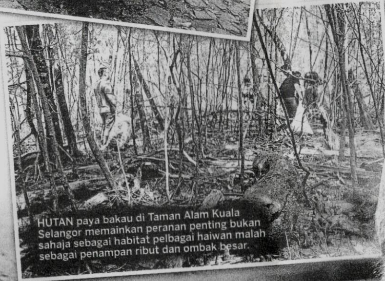
HUTAN paya bakau di Taman Alam Kuala Selangor memainkan peranan penting bukan sahaja sebagai habitat pelbagai haiwan malah sebagai penampas ribut dan ombak besar.

Dibuka sejak tahun 1986, kawasan tersebut merupakan satu-satunya di Kuala