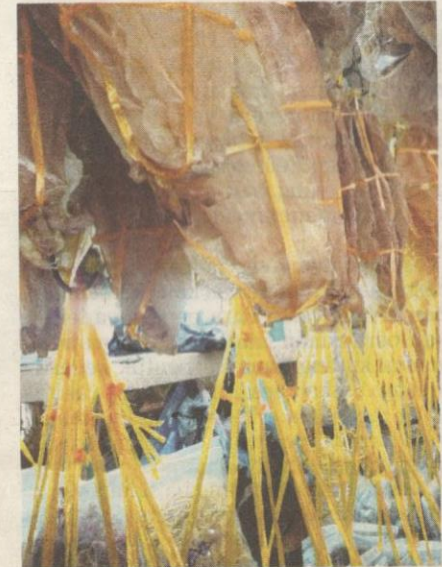
IKAN masin di Pasar Tanjung antara produk yang paling banyak mendapat permintaan.

Beliau yang ditemui di pasar itu berkata, setiap kali berunding ke