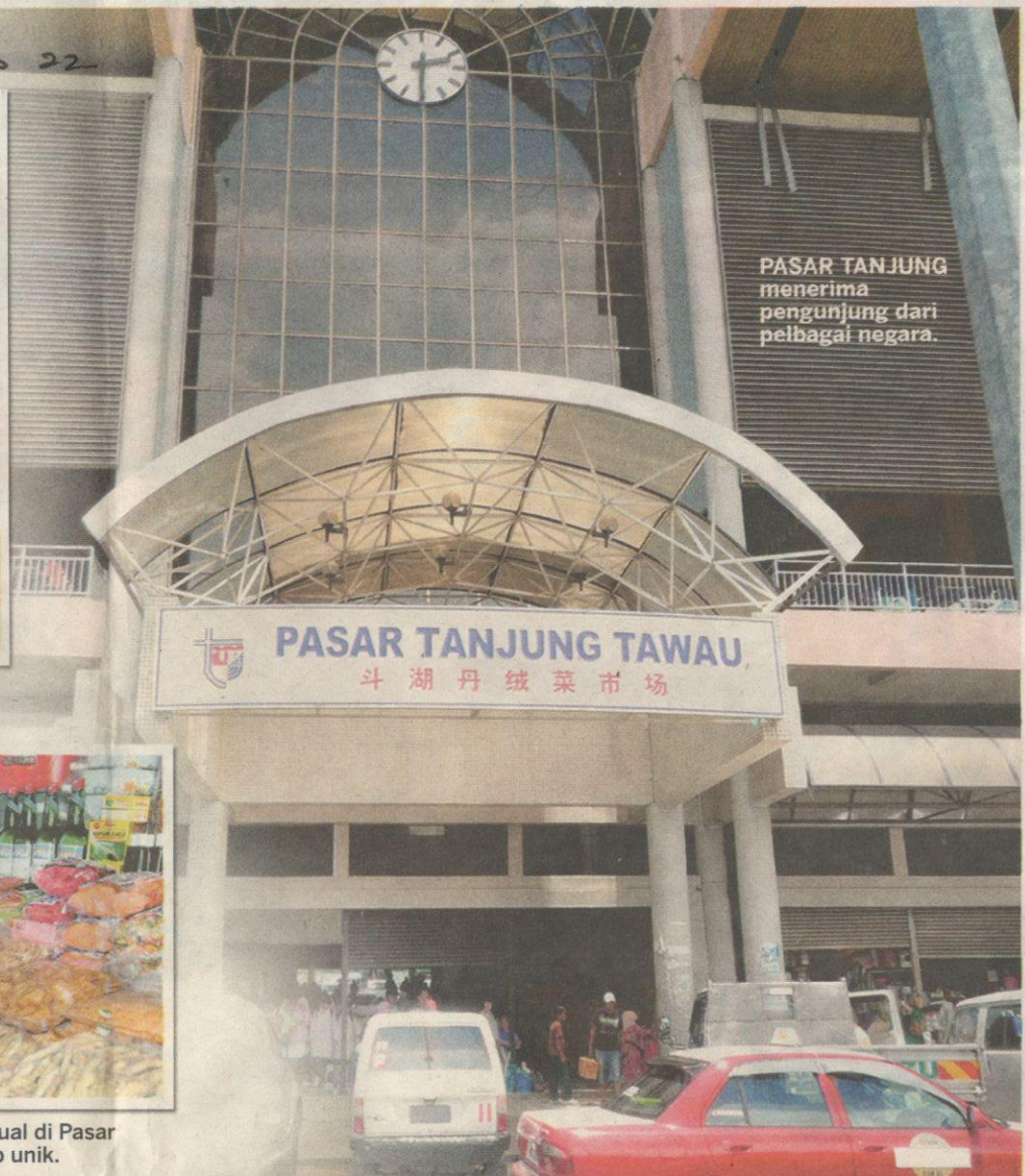
PASAR TANJUNG menerima pengunjung dari pelbagai negara.