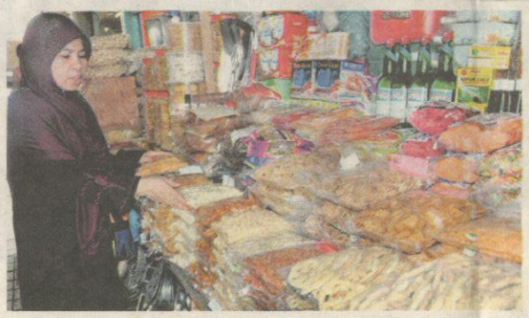
KEPELBAGAIAN makanan ringan yang dijual di Pasar Tanjung menjadikan pasar tersebut cukup unik.