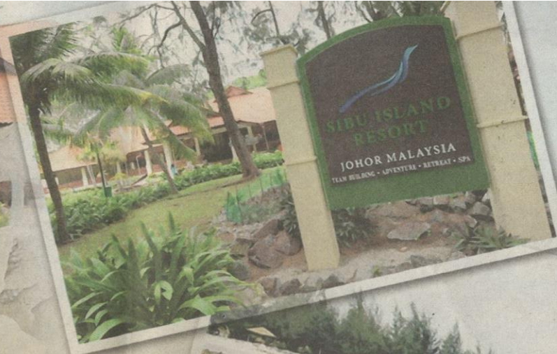
KIRI: Hiasan landskap yang indah melitari laluan masuk ke Sibul Island Resort.