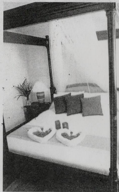
PASANGAN pengantin pasti teruja dengan dekorasi bilik yang dihias romantik bagi mengalu-alukan kedatangan mereka.