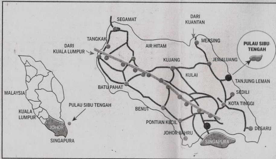
PETA kedudukan Sibul Island Resort.

"Melalui aktiviti ini yang akan ditemani jurupandu, pengunjung berpeluang mengenali pelbagai tumbuhan hutan dan spesies burung.