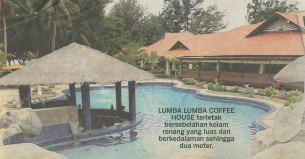
LUMBA LUMBA COFFEE HOUSE terletak bersebelahan kolam renang yang luas dan berkedalaman sehingga dua meter.