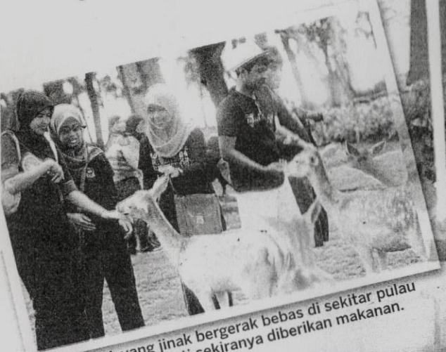
RUSA-RUSA yang jinak bergerak bebas di sekitar pulau telah mudah didekati sekiranya diberikan makanan.