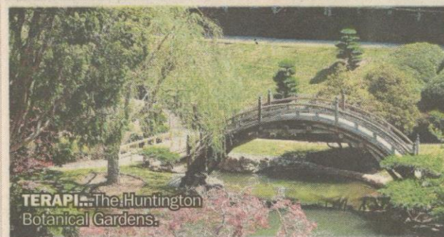
TERAPI... The Huntington Botanical Gardens.