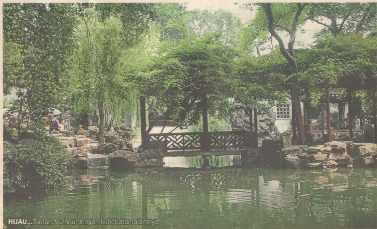
HIJAU... Taman Suzhou dengan kehebatan alamnya.

Sering menjadi tumpuan dunia dan lokasinya di tengah kota membuatnya