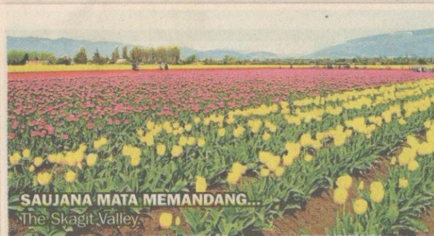
SAUJANA MATA MEMANDANG...