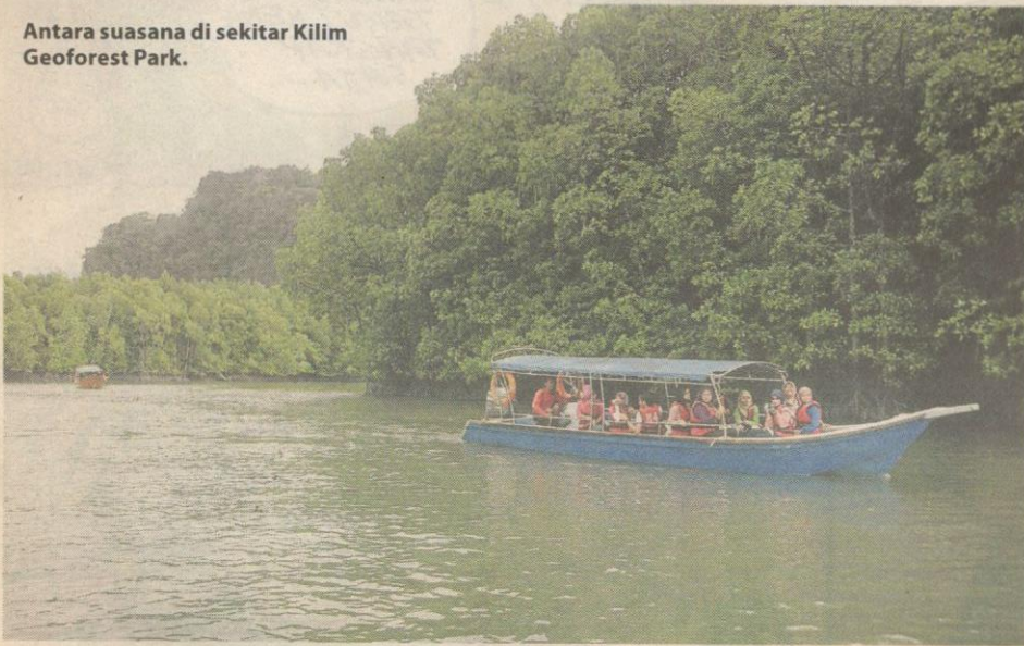
Antara suasana di sekitar Kilim Geoforest Park.