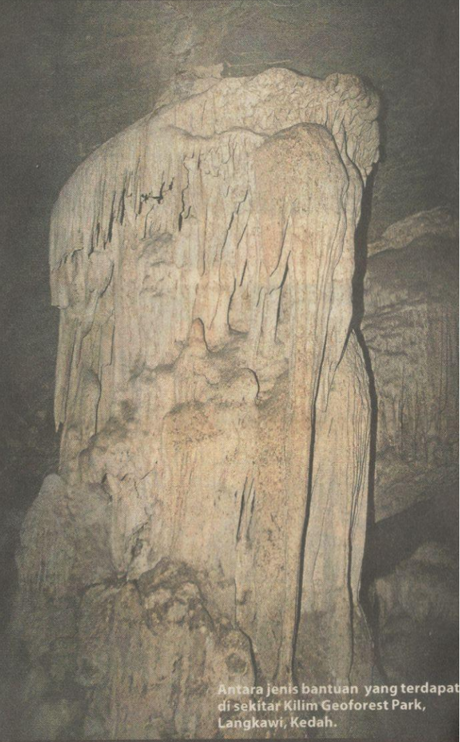
Antara jenis bantuan yang terdapat di sekitar Kilim Geoforest Park, Langkawi, Kedah.

Pada sebelah malam, peserta rombongan dibawa menikmati jamuan makan malam di Favehotel Chenang Beach, sebelum bertolak pulang ke destinasi masing-masing pada awal pagi.