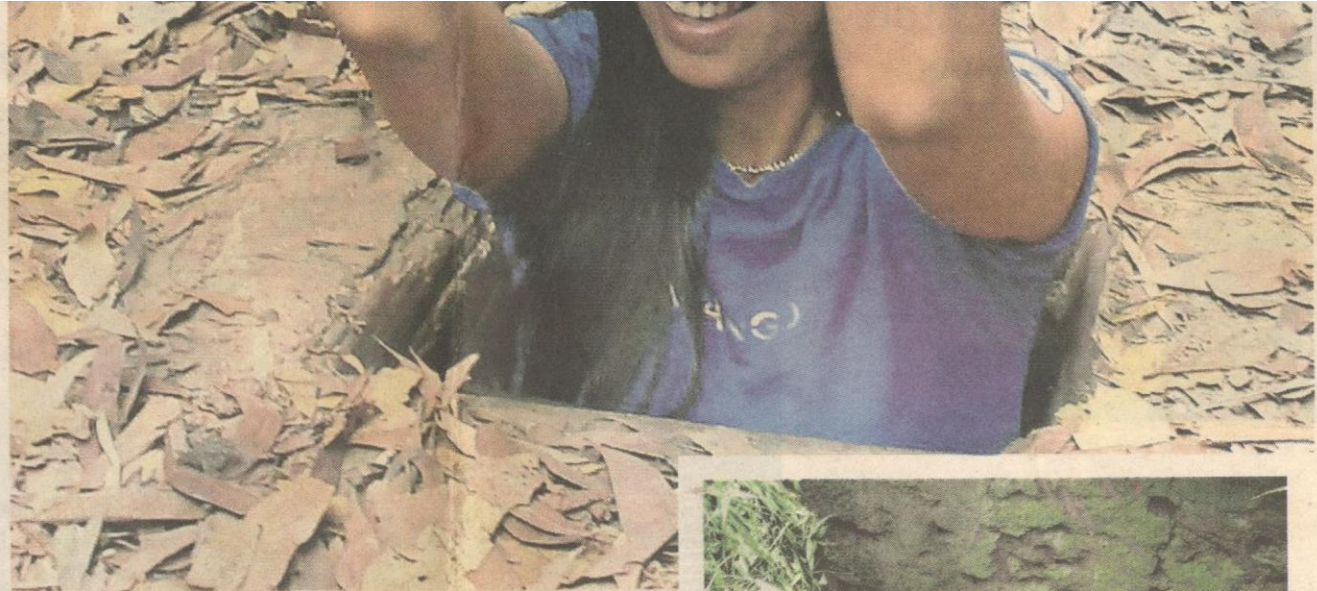
Lubang tikus tempat persembunyian hanya mampu dimasuki mereka yang berbadan kurus.

Berada di Terowong Cu Chi (yang disebut Shu Chi) menyedarkan kita bahawa semangat dan perjuangan rakyat Vietnam yang tinggi mampu mengatasi senjata dan peralatan perang canggih dimiliki Amerika.