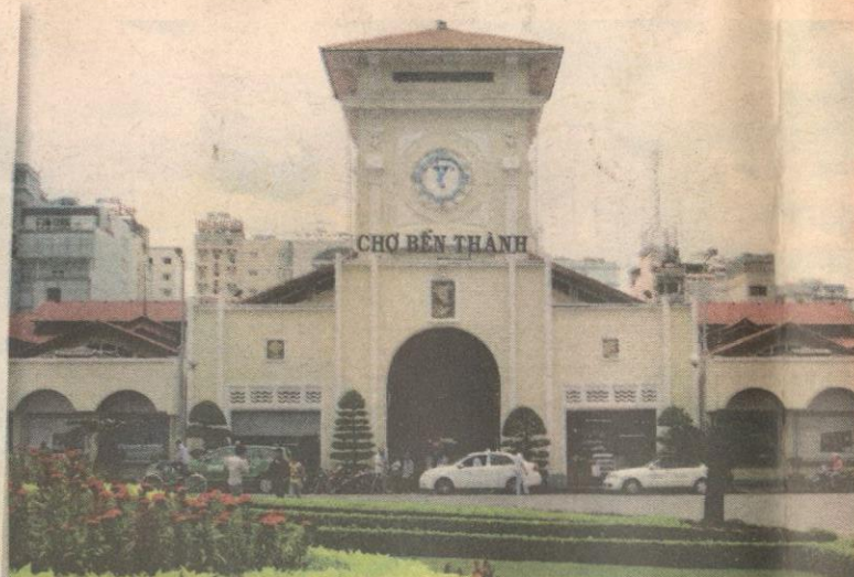
Pasar Ben Thanh