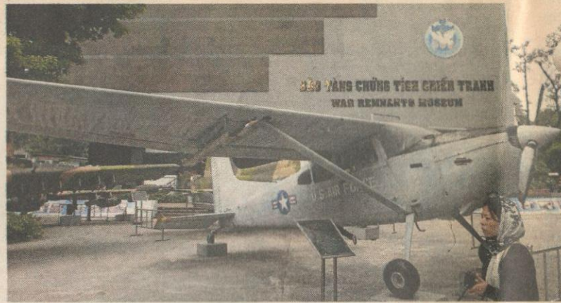
Muzium Perang Vietnam

Pasar malam ini memang membuatkan pengunjung rambang