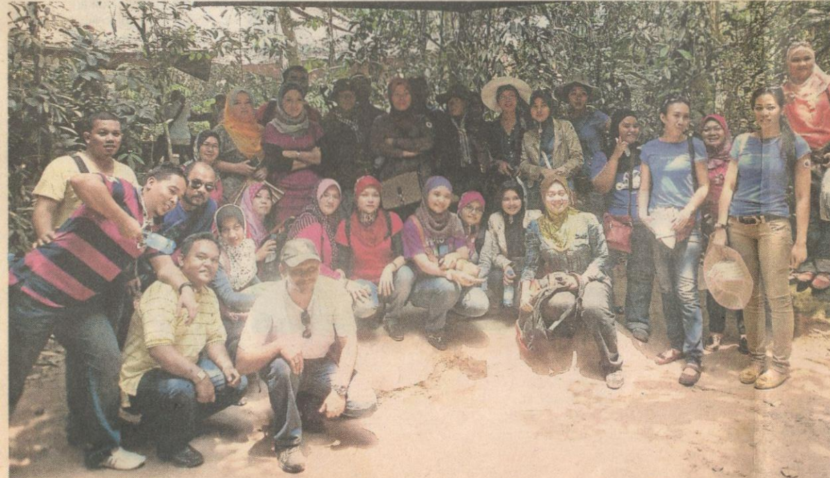
Wakil pengedar Hai-O Marketing berpeluang menerokai suasana zaman perang di Chu Chi Tunnel.

1 Rancang percutian dengan mengetahui serba sedikit mengenai lokasi yang bakal dikunjungi. Jika mahu keluar negara antara yang perlu di ambil kira adalah maklumat nilai tukaran wang, waktu dunia, cuaca dan tidak kurang penting jarak ke destinasi yang ingin dituju.