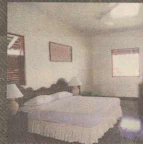
Penginapan di Semporna

⊙ Permit untuk menyelam disediakan di Pulau Mabul tetapi sebaik-baiknya diuruskan lebih awal.