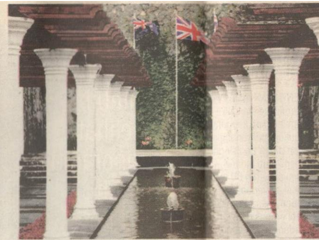
TENANG... laman yang dibina memberikan ketenangan kepada pengunjung.

Ia dibuka dari jam 8 pagi hingga 5 petang. Pemprosesan