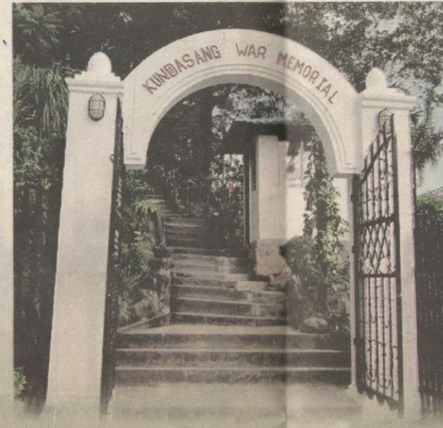
SELAMAT DATANG... Kundasang War Memorial mempunyai cerita tersendiri.