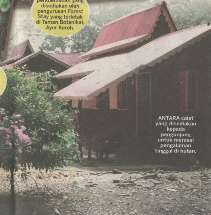
ANTARA calet yang disediakan kepada pengunjung untuk merasai pengalaman tinggal di hutan.