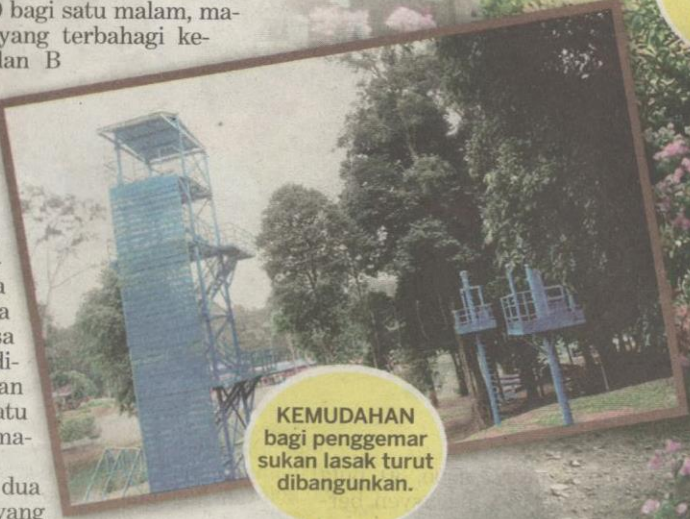
KEMUDAHAN bagi penggemar sukan lasak turut dibangunkan.