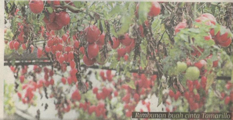
Rimbunan buah cinta Tamarillo