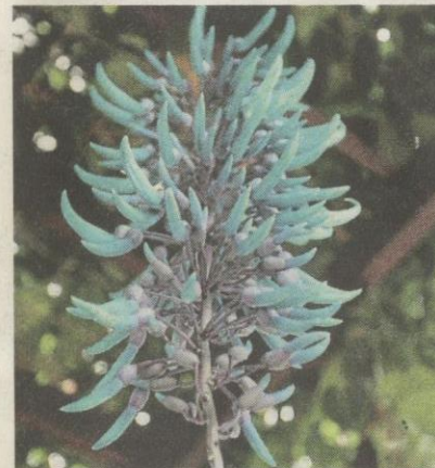
Tarikan bunga Vines tercantik dari Filipina, Jade Vine .

"Rancangan terbaru adalah membina laluan kereta kabel merentasi MARDI dan Ladang Teh Boh, pembinaan kolam ikan musim sejuk iaitu Trout dan Sturgeon dengan kerjasama Jabatan Perikanan serta pembukaan spa herba dengan kerjasama Koperasi Bigdee," katanya bersedia meningkatkan taraf agropelancongan ini bagi menarik lebih ramai pelancong domestik mahupun antarabangsa, kelak.