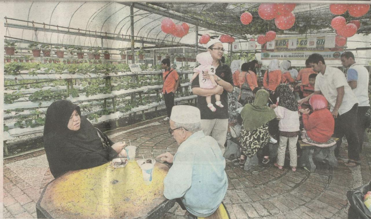
Pengunjung tidak melepaskan peluang menyerbu pusat jualan strawberry jenis camarosa dan camaroga .

Namun, tiada yang tahu keunikan stesen MARDI di pusat peranginan terkenal ini menempatkan kebun teh tertua seluas 2.8 hektar selain kilang teh pertama negara berusia lebih 83 tahun.