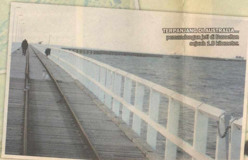
TERPANJANG DI AUSTRALIA... pemandangan Jeti di Busselton sejauh 1.8 kilometer.

>>Oleh ABDUL KADIR HAMZA am@hmetro.com.my (yang mengikuti lawatan AirAsia X dengan kerjasama Pelancongan Australia ke Perth, baru-baru ini)