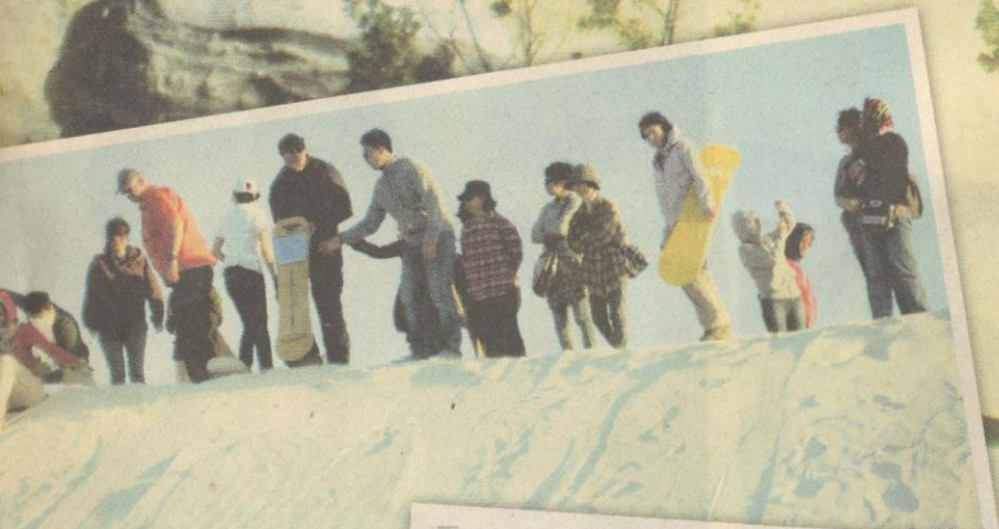
PENGALAMAN... pelancong menyelusuri lereng bukit pasir di gurun.