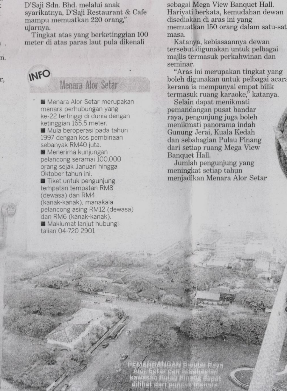
PEMANDANGAN Bandar Raya Alor Setar dan sebahagian kawasan Pulau Pinang dapat dilihat dari puncak menara.