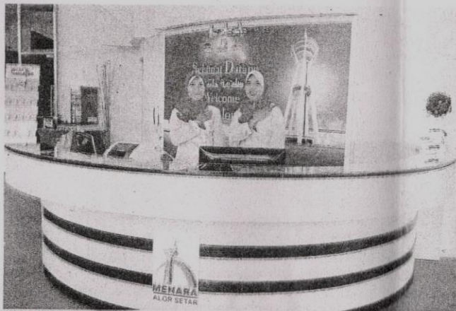
KAKITANGAN Menara Alor Setar sedia menanti dan menyambut mesra kedatangan pelancong ke menara itu.

Bangunan yang menelan kos sebanyak RM40 juta itu menjadi mercu tanda negeri Jelapang Padi sejak dibuka pada tahun 1997. Menara telekomunikasi ke-22 tertinggi di dunia dan kedua tertinggi di Malaysia