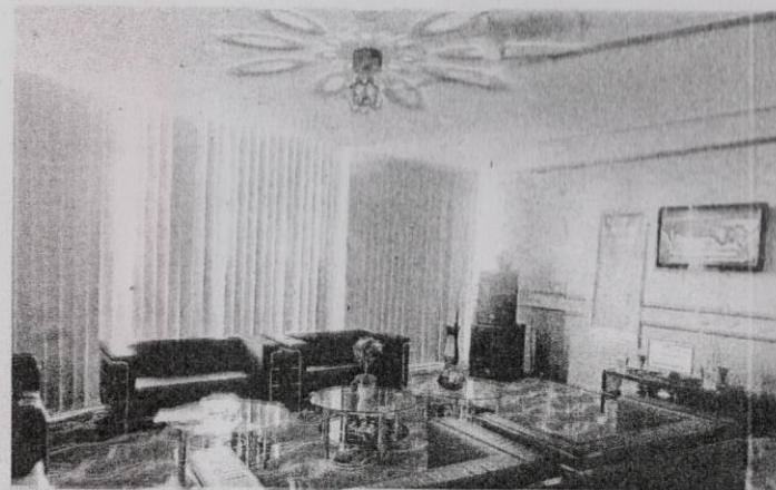
JIKA ada kelapangan masa, nikmati makan malam dan sesi karaoke di Mega View Banquet Hall, Menara Alor Setar.