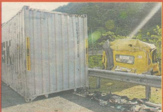
REMUK...bahagian depan bas ekspres rosak teruk selepas merempuh treler rosak di kiri jalan.