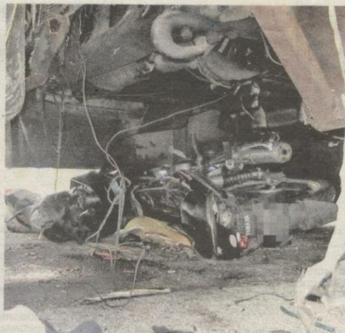
Perlanggaran berkenaan menyebabkan mangsa tersepit di antara dua bas.