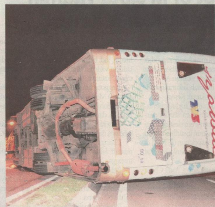
Kedudukan bas ekspres yang melintang menghalang laluan setelah terbalik.

"Tiga mangsa mengalami kecederaan ringan dihantar ke Hospital Alor Gajah sebagai pesakit luar," katanya.