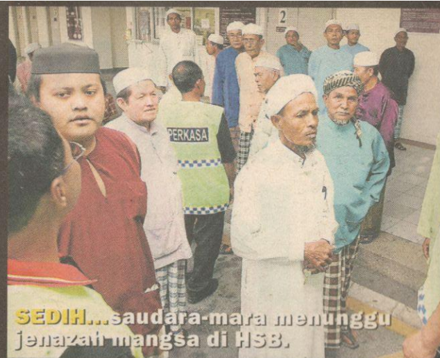
SEDIH... saudara-mara menunggu jenazah mangsa di HSB.