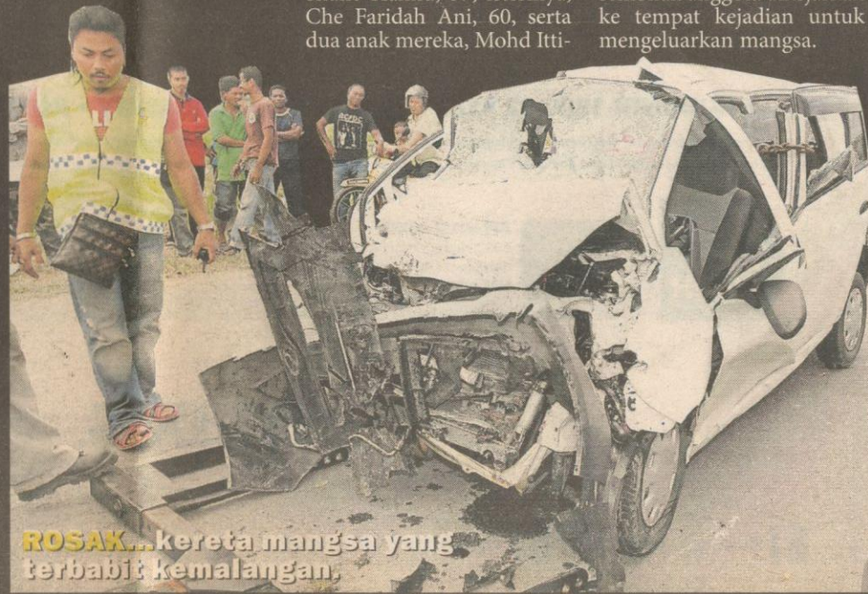
ROSAK...kereta mangsa yang terbabit kemalangan.

“Lebih menyedihkan, saya tidak dapat berbuat apa-apa untuk menyelamatkan mangsa yang menjerit meminta tolong. Kami hanya mampu menghubungi bomba untuk mengeluarkan mangsa kemalangan itu,” katanya.