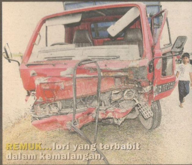
REMUK...lori yang terbabit dalam kemalangan.