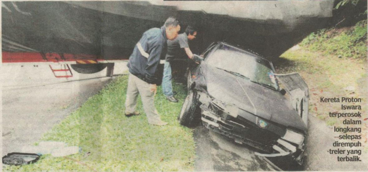
Kereta Proton Iswara terperosok dalam longkang selepas dirempuh treler yang terbalik.