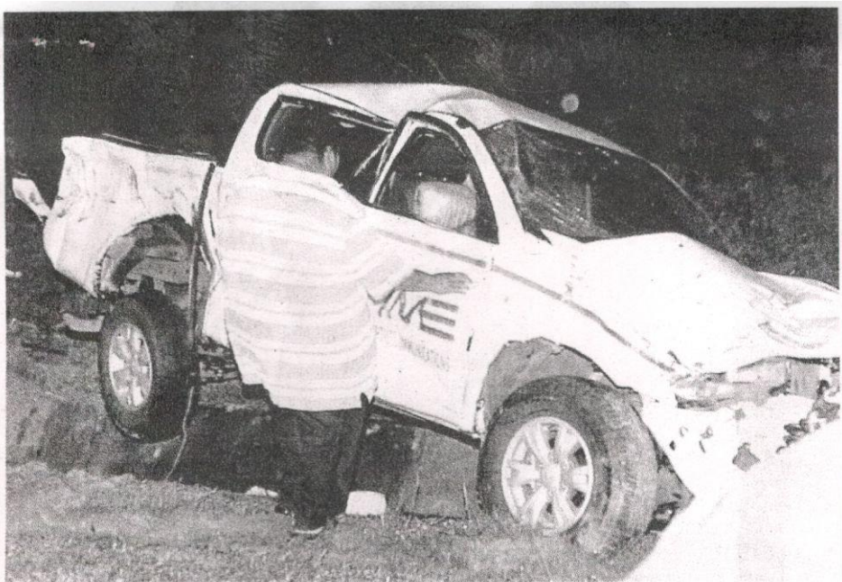
Keadaan pacuan empat roda yang dirempuh treler membawa muatan makanan ringan.