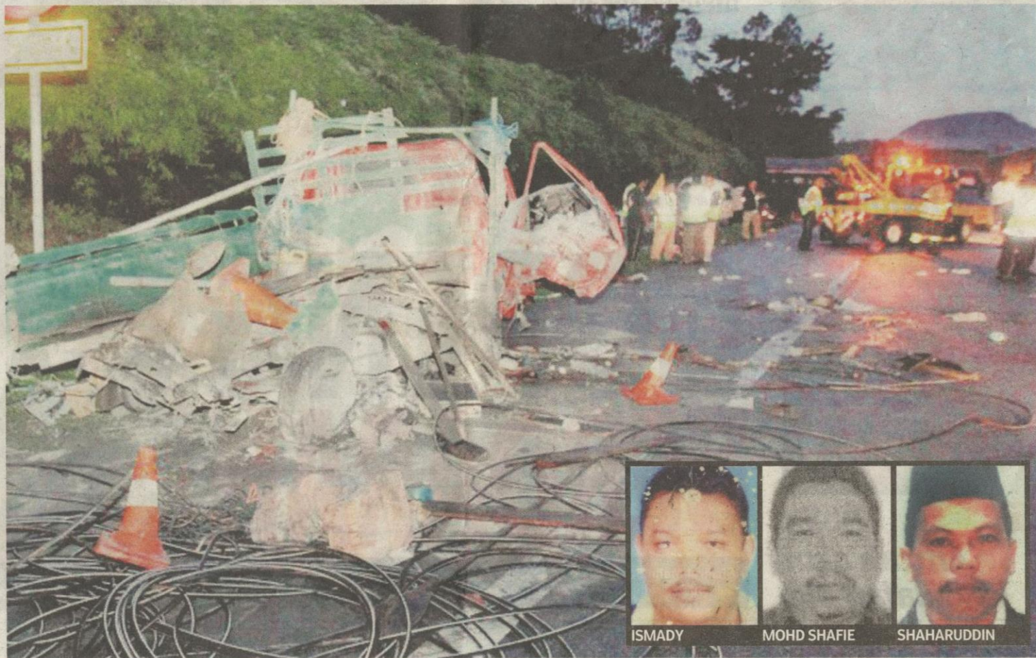
Keadaan lori yang diletakkan di lorong kecemasan hampir hancur sepenuhnya selepas dirempuh treler, semalam. Gambar kecil: Mangsa yang terbunuh.

Ketiga-tiga yang terbunuh dihantar ke rumah mayat, Hospital Kampar untuk bedah siasat, manakala mereka yang cedera parah dirawat di HRPB.