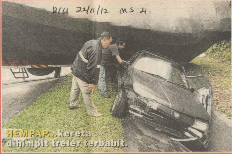
HEMPAP...kereta dihimpit treler terbabit.