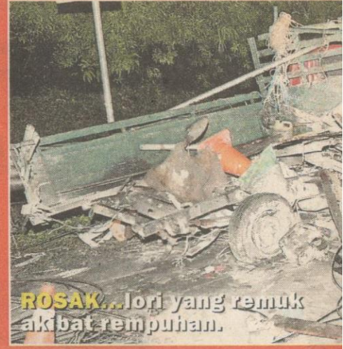
ROSAK...lori yang remuk akibat rempuhan.