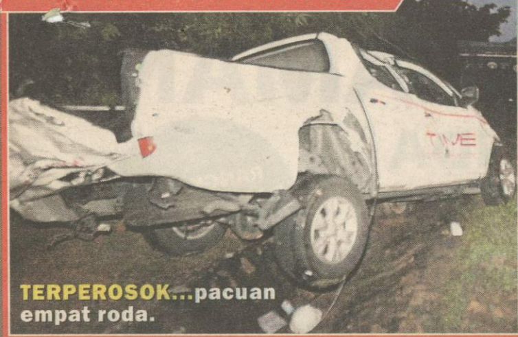
TERPEROSOK...pacuan empat roda.