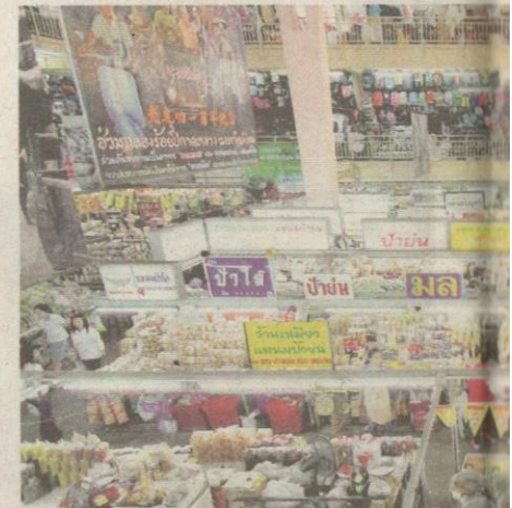
PASAR Warorot, Chiang Mai merupakan ternak berkualiti dengan harga yang murah.

Sebelum itu, dari Chiang Mai kami terus menaiki bas selama empat jam menuju Chiang Rai. Ketika dalam perjalanan kami dapat melihat persekitaran bumi Thailand yang melalui kawasan sawah padi, kebun getah dan jagung serta hutan-hutan simpan tropika yang masih kekal cantik.