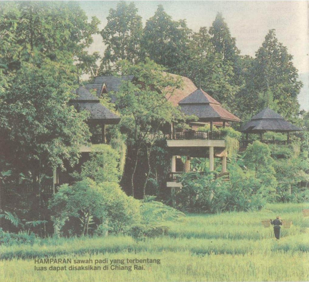
HAMPARAN sawah padi yang terbentang luas dapat disaksikan di Chiang Rai.

dapat di Chiang Mai ialah Pasar Warorot atau dikenali sebagai Kad Luang oleh masyarakat tempatan.