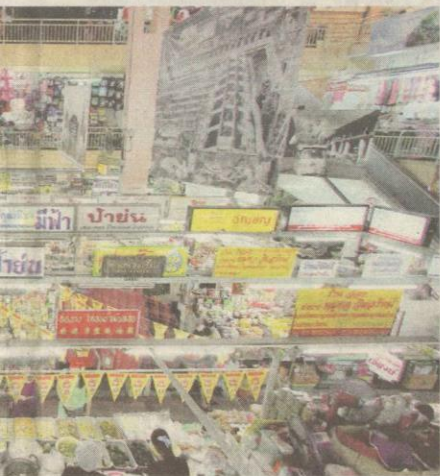
t yang sesuai untuk membeli barangan