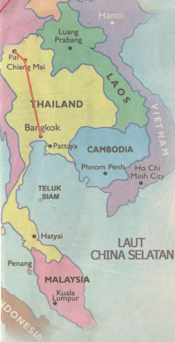
PETA menunjukkan lokasi Chiang Mai, Thailand.

P ENGALAMAN mengikuti rombongan bersama Majlis Guru Besar Daerah Rompin selama tiga hari dua malam ke Chiang Mai dan Chiang Rai, Thailand merupakan satu pengalaman yang amat berharga.