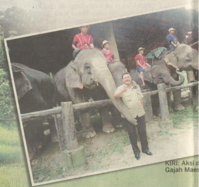
KIRI: Aksi c Gajah Maes