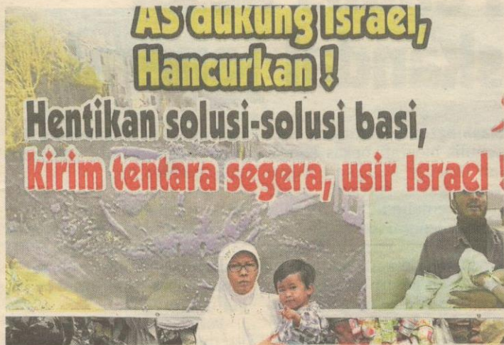
Bantahan anti-Israel diadakan di depan Kedutaan Amerika di Jakarta.