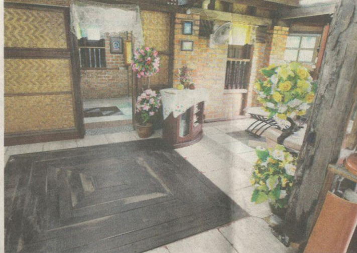
SEBAHAGIAN dinding di ruang tamu dihiasi dengan kelarai.

“Bunyi itu biasa bagi lantai kayu tetapi jangan khuatir kerana rumah ini