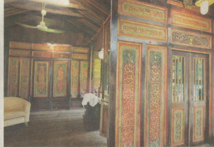
UKIRAN Asma Ul Husna menghiasi hiasan dalam rumah Ahmad menjadi ciri-ciri yang menarik.

mampu menampung lebih 100 orang,” katanya sambil tersenyum.