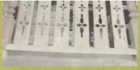
HASIL ukiran kayu membangkitkan nostalgia.