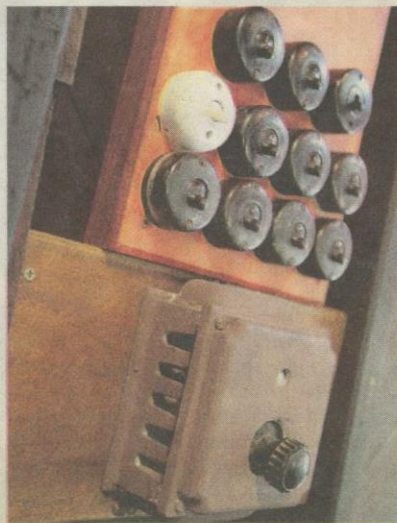
PERALATAN elektrik lama seperti suis lampu ini menambah rasa nostalgia pada rumah kayu ini.

Apatah lagi dikelilingi pohon-pohon yang menghijau di halaman ru-