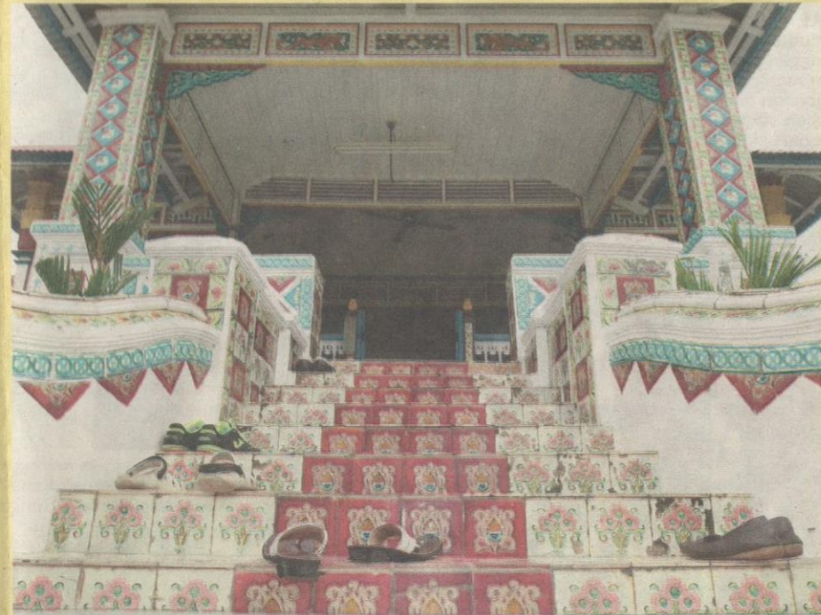
TANGGA batu di Rumah Penghulu Natar, Merlimau, Melaka ini semakin sukar dilihat selepas banyak generasi baharu membina rumah moden.

Dalam pada itu, beliau berkata, melihat kepada hasil ukiran ia sebenarnya melambangkan kemahiran orang dahulu dalam bidang ukiran kayu.