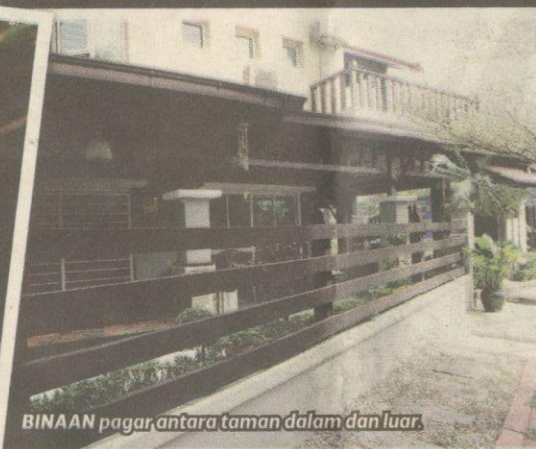
BINAAN pagar antara taman dalam dan luar.