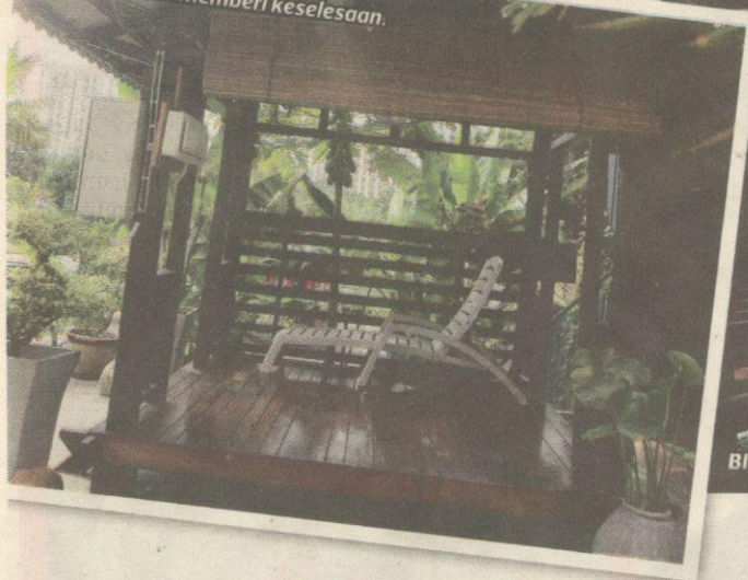
WAKAF santai memberi keselesaan.