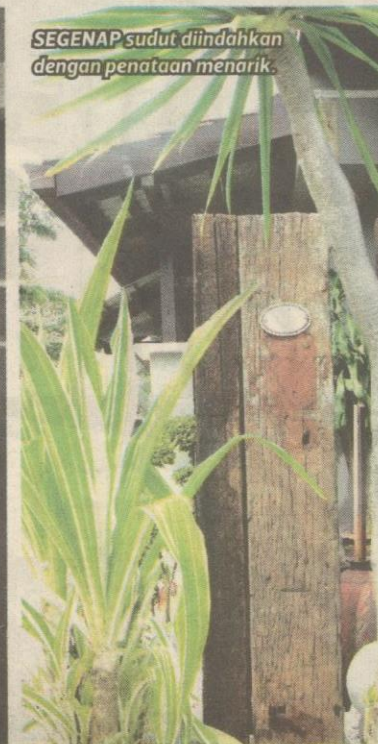
SEGENAP sudut diindahkannya dengan penataan menarik.