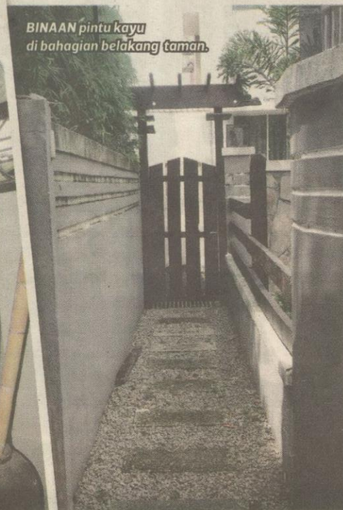
BINAAN pintu kayu di bahagian belakang taman.