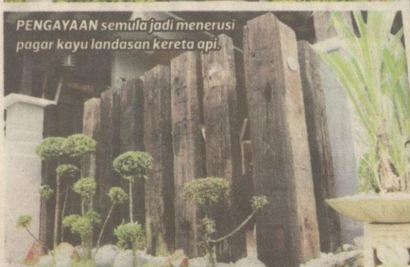
PENGAYAAN semula jadi menerusi pagar kayu landasan kereta api.