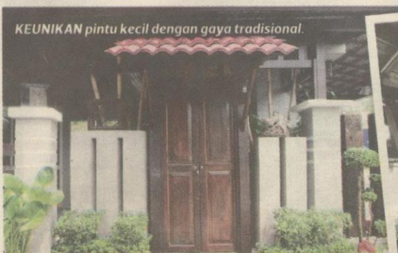
KEUNIKAN pintu kecil dengan gaya tradisional.

Reka bentuk pintu itu yang mengilhamkan gaya tradisional apabila ia tam-