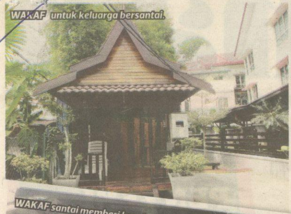
WAKAF untuk keluarga bersantai.