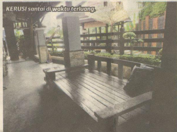
KERUSI santai di waktu terluang.