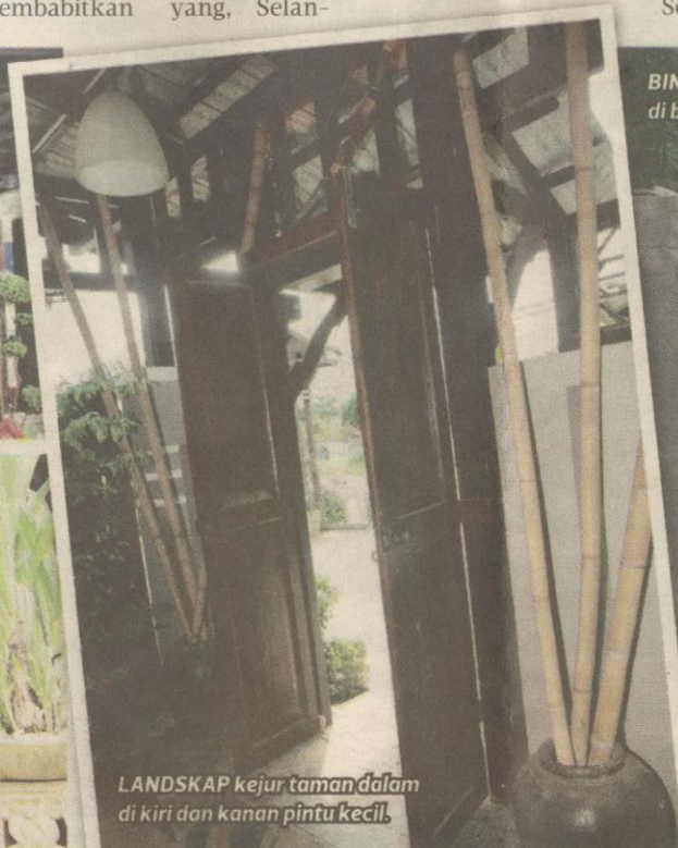
LANDSKAP kejur taman dalam di kiri dan kanan pintu kecil.