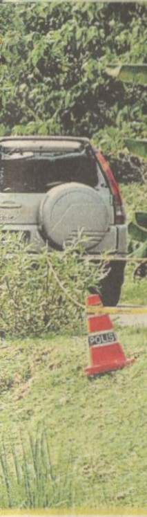
Anggota polis mengumpul maklumat daripada penduduk Kampung Tun Sardon, Ara Kuda, Tasek Gelugor, semalam.