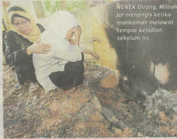
NENEK Dirang, Milnah Jol menangis ketika mahkamah melawat tempat kejadian sebelum ini.