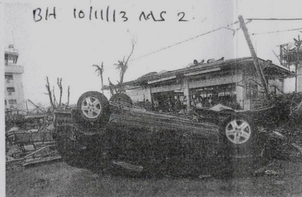
Sebuah kereta terbalik di luar lapangan terbang yang musnah selepas taufan Haiyan melanda Tacloban.