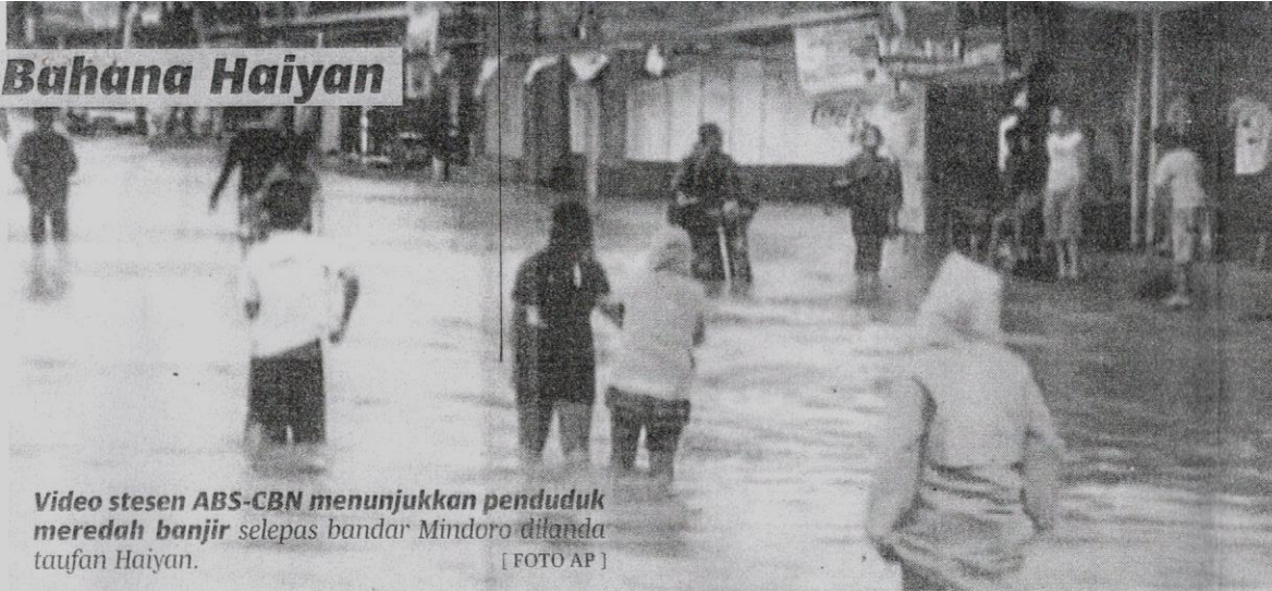
Video stesen ABS-CBN menunjukkan penduduk meredah banjir selepas bandar Mindoro dilanda taufan Haiyan.