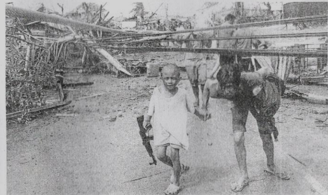
Wanita dan anaknya lalu di bawah kabel elektrik selepas tiang bekalan tumbang dibadai taufan Haiyan di Tacloban.