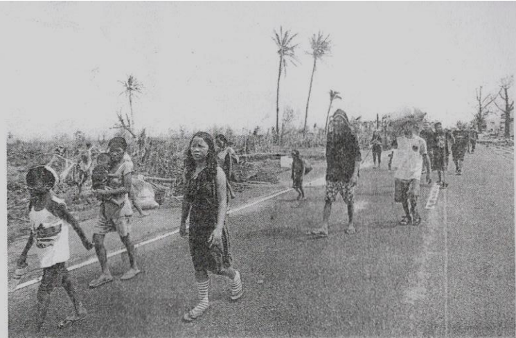
Mangsa melalui kawasan yang musnah kerana taufan Haiyan ketika berusaha mendapatkan bantuan.