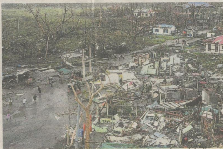
Kedadaan di sebahagian bandar Tacloban dengan banyak kediaman musnah kerana taufan Haiyan.

© Haiyan adalah taufan kategori 5 kedua melanda Filipina tahun ini © Secara purata, 20 taufan melanda setiap tahun