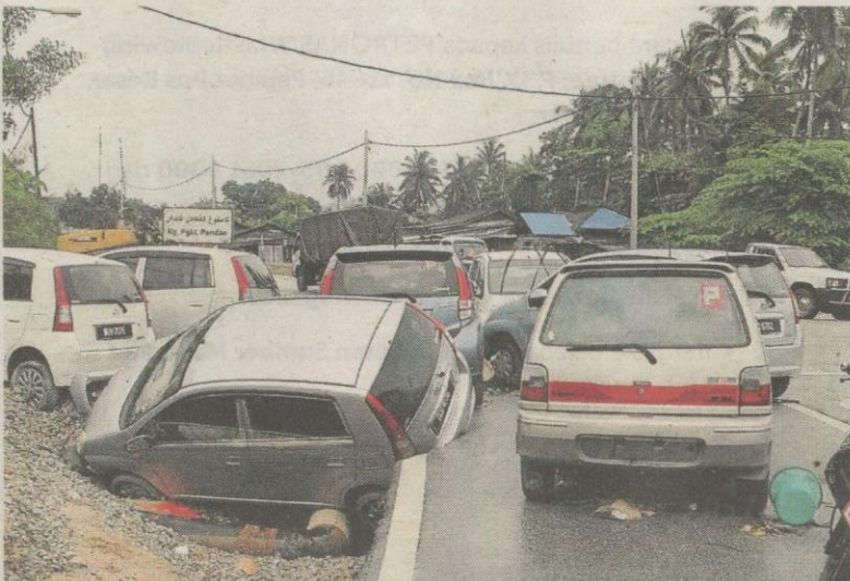
Antara kenderaan yang tersadai di Bandar Baru Bukit Mentok, Kemaman akibat banjir.

Oleh Lum Chee Hong, Luqman Arif Abdul Karim dan Shamsudin Husin bhnews@bh.com.my