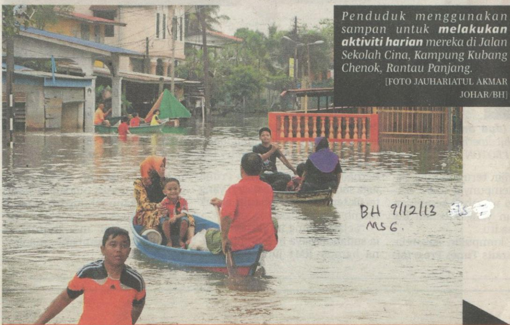
Penduduk menggunakan sampans untuk melakukan aktiviti harian mereka di Jalan Sekolah Cina, Kampung Kubang Chenok, Rantau Panjang.