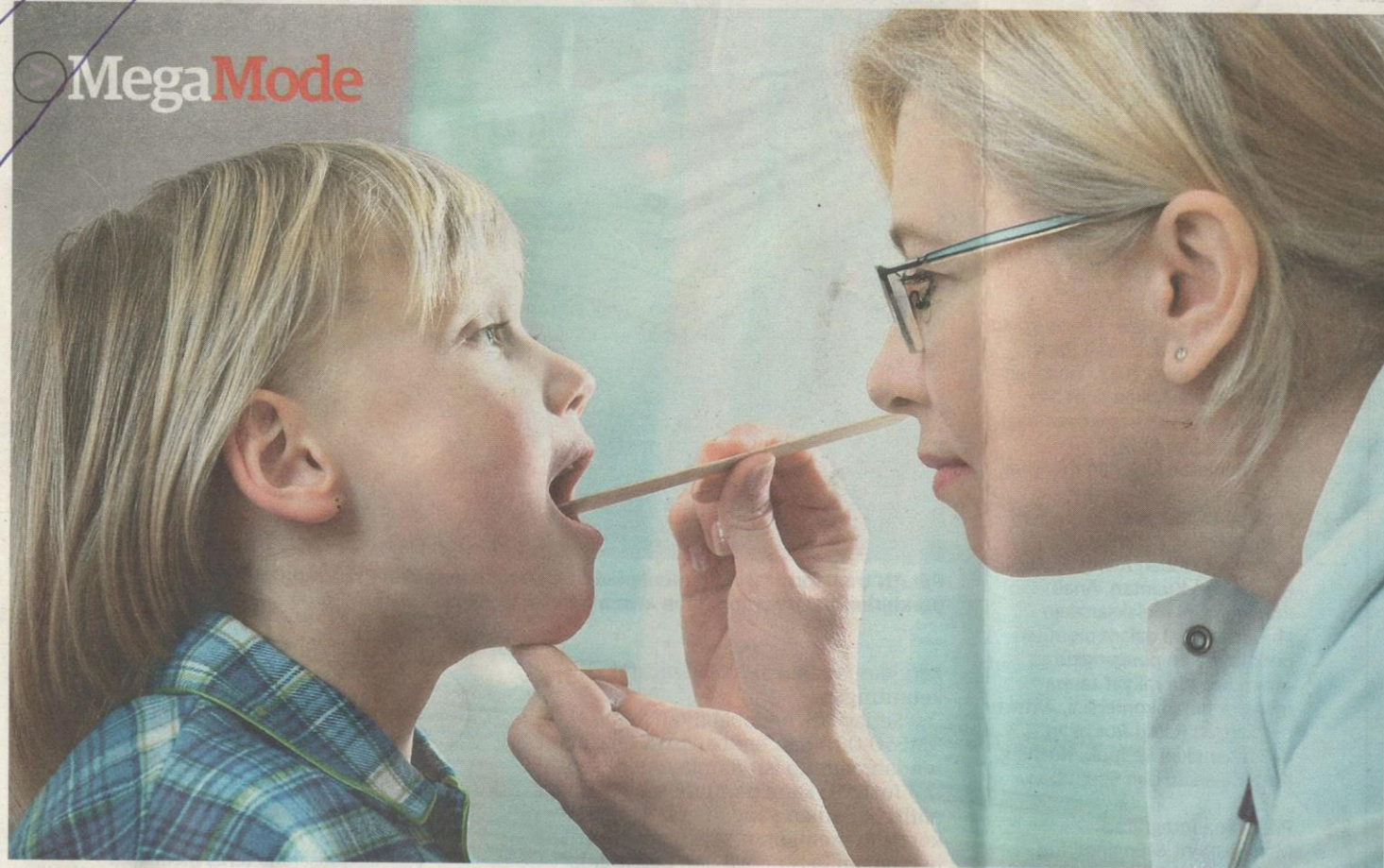
KANAK-KANAK kerap mengalami tonsilitis yang disebabkan oleh jangkitan virus.