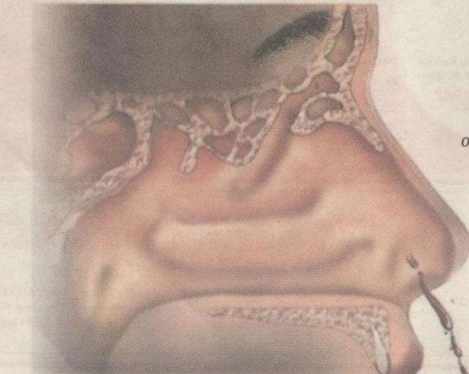
Masalah hidung berdarah dideritai oleh pesakit tanpa mengenal usia.