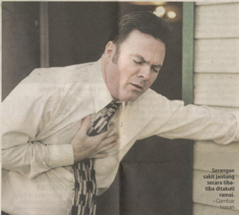
Serangan sakit jantung secara tiba-tiba ditakuti ramai. - Gambar hiasan

Herbalis profesional bertaraf dunia. Juru runding dan pendidik nutrisi holistik. Buku: Kawal Berat Badan, V. Aromaterapi, Serangan Jantung, Diabetes Jenis 2. Rawat Dengan Herba – Cegah Demam & Flu.