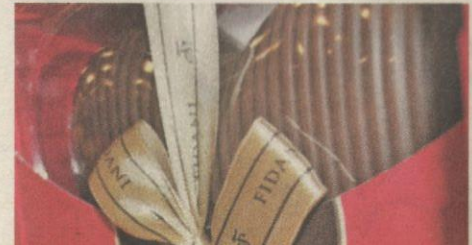
- Mohd Azuan

“Muzium ini juga membolehkan orang ramai melihat demonstrasi cara penyediaan coklat menggunakan mesin salut coklat, mesin percutakan dan teknik pencairan coklat.”