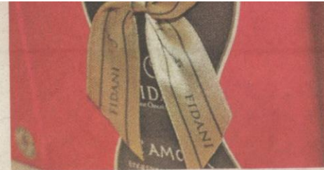
Coklat jenama Fidani.