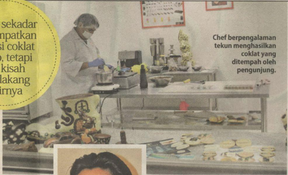
Chef berpengalaman tekun menghasilkan coklat yang ditempah oleh pengunjung.