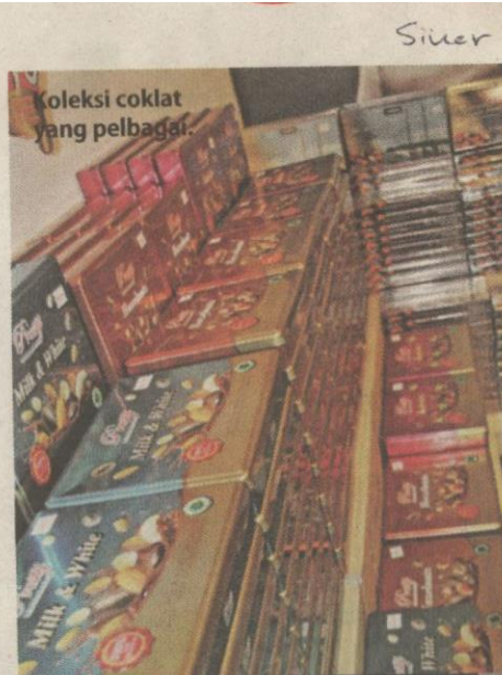
Koleksi coklat yang pelbagai.

"Muzium ini juga membolehkan orang ramai