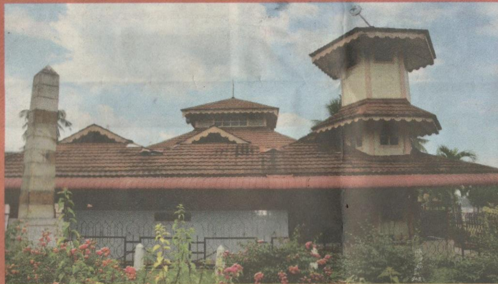
Tugu Birch didirikan berdekatan Masjid Lama, Pasir Salak.

Lawatan ke Kompleks Bersejarah Pasir Salak baru-baru ini, memperlihatkan suasana yang agak suram.