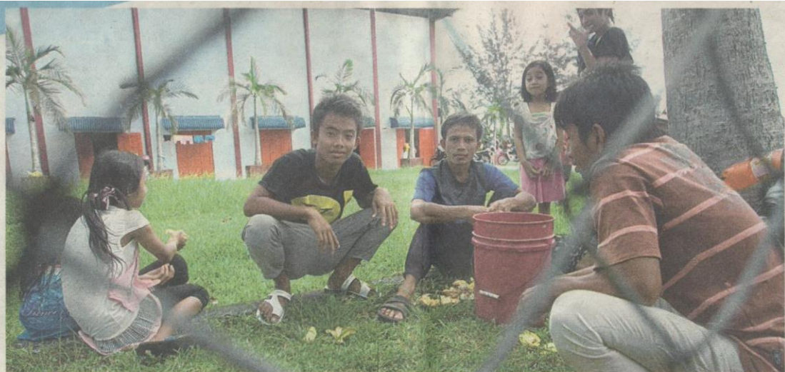
PENDUDUK berkumpul di Dewan Embara Budi Felda Sahabat selepas serangan dilancarkan.