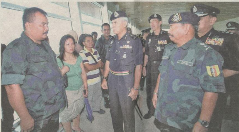
PESURUHJAYA Polis Sarawak, Datuk Acryl Sani Abdullah Sani (tengah) memberi kata-kata semangat kepada anggota 1 Batalion PGA Sarawak yang akan ditugaskan di Lahad Datu semalam.