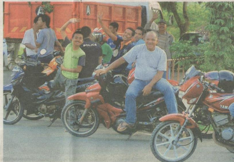
KANAN: Sebahagian penduduk Kampung Tanduo yang enggan pulang ke rumah walaupun pasukan keselamatan sudah membenarkan mereka berbuat demikian.